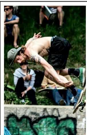
Do skateparku se v květnu sjeli mistři jízdy na skateboardu. ...3