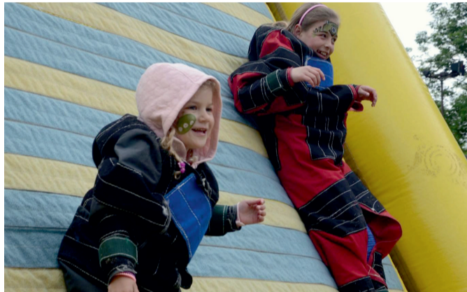
A mouchy už sedí přilepené na stěně.

Westernový a Pirátský den, které se na Vostrově uskutečnily v režii Klubu dřívě, přilákaly stovky návštěvníků. Laťka byla tedy nasazena vysoko. Jenže mimozemšťané táhnou. A tak se parkoviště postupně zaplnilo auty a mladých kosmonautů stále přibývalo.