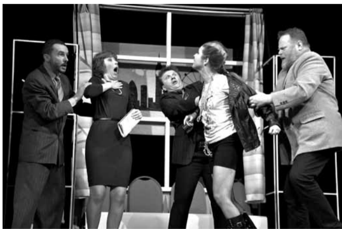
Doktor Mortimer nevěděl o své dceři až do jejich osmnácti let.

Nová představení místních hereckých nadšenců se v poslední