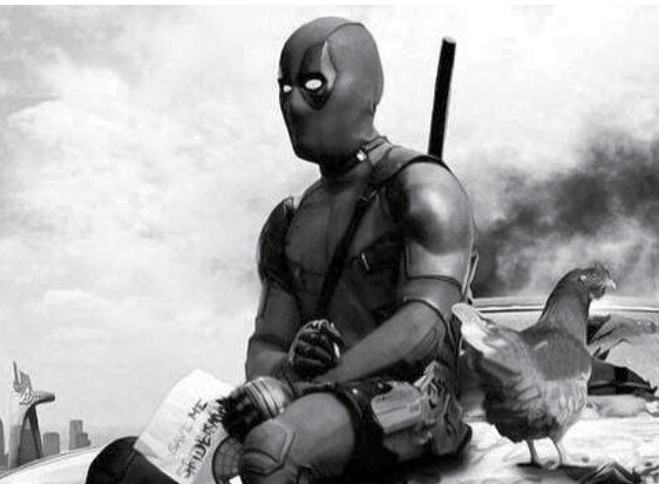
Komiksového Deadpoola 1. dubna uvidí konečně také Mnichovo Hradiště.