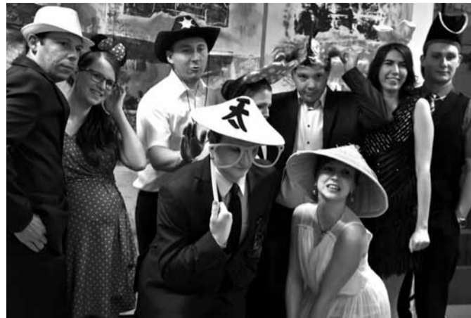
Fotografování před fotostěnou bylo v průběhu večera stále populárnější.