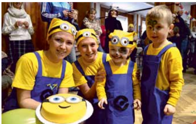
Vítězní mimoňové dobrovolně vyměnili banány za dort s vlastní podobiznou.