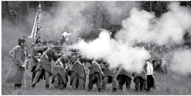
Rekonstrukce historické bitvy bude vrcholem prvomájového programu.