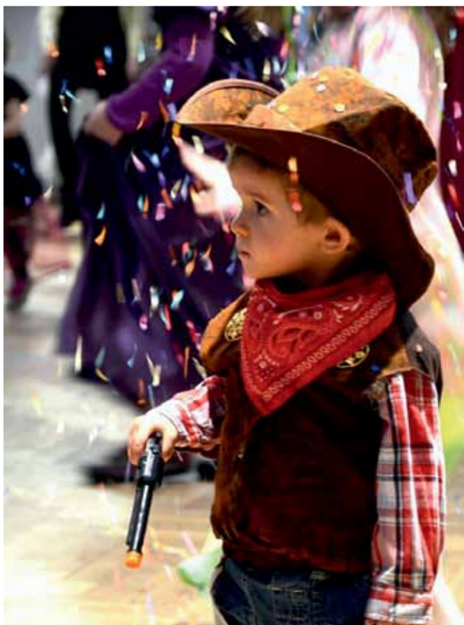
Kovboj v dešti konfet, to je k vidění jen v muzikálech a na karnevalech.