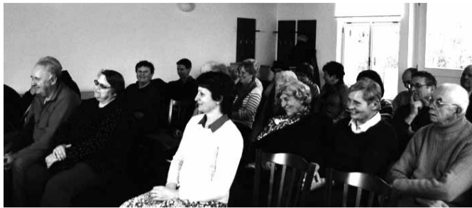
A posluchači se bavili, žasli a vzpomínali.