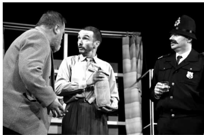
A všechno se šmoudrchá a šmoudrchá. Ke slovu se dostane i policie.