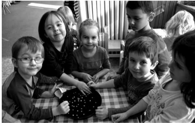
Děti se seznámily s tím, jak vzniká mouka i čerstvé pečivo.

Děti se dozvěděly, jak se z obilí zpracovává mouka, měly možnost prohlédnout si různé druhy mouky, ochutnat pečivo z nich připravené. Hrály si na mlynáře, na pekaře, samy také těsto zadělávaly a upekly si třeba chleba nebo zajičky z kynutého těsta. Ale protože příroda se probouzí a přichází jaro, využili jsme také různá zrníčka a semínka k setí, a děti tak mohly a nadále mohou