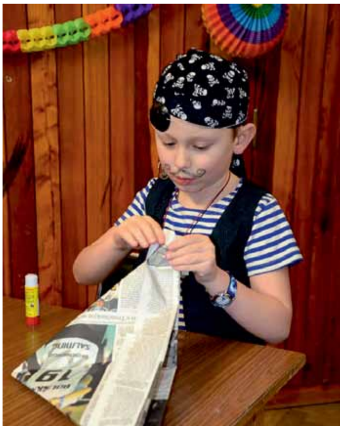
Na stanovišti u Večernička se děti učily skládat čepice z novinového papíru.