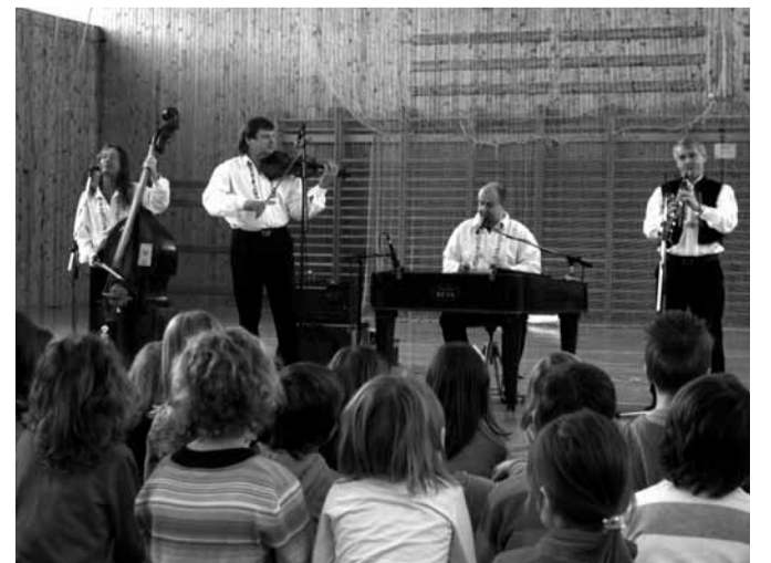
S muzikanty si žáci na závěr dokonce zatančili, když zazněl Kabát.