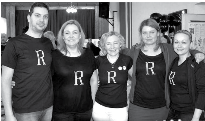
Tým organizátorů historicky prvního hradištského Restaurant Day.