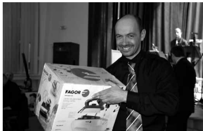
Mnohé účastníky plesu cestou domů tížila výhra.