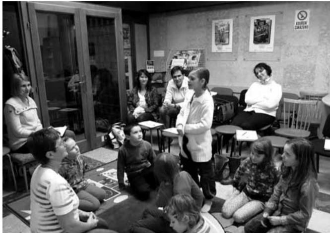
Hodinový program vycházel z knihy Kouzelná baterka.