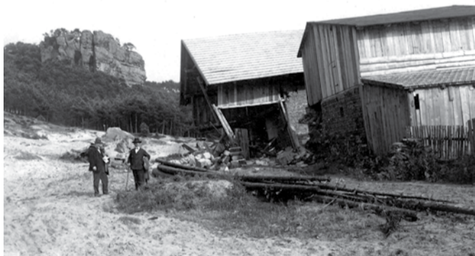
Sesuv půdy u Dneboha v roce 1926.

Máte doma nějakou zajímavost k hoře Mužský? Třeba fotografie či dokumenty, které jste ochotni poskytnout pro pořízení kopii? Napište nám na email filip.krasny@seznam.cz , děkujeme!