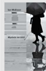
IAN MCEWAN: MYSLETE NA DĚTI

Román líčí osud malého židovského chlapce, který sám prožil druhou světovou válku na zaostalém venkově kdysi ve východním Polsku či na Ukrajině. Osamělé dítě působilo jako vetřelec a ve vypjatém období aktuálního ohrožení bylo vystaveno všem myslitelným útokům primitivních venkovanů a hrůzných válečných poměrů mělo zostřeno svou odlišnost a samotu. Ve chvíli životního ohrožení se chlapec dostal mezi rudoarmějce a teprve u nich se setkal s lidským zacházením a porozuměním.