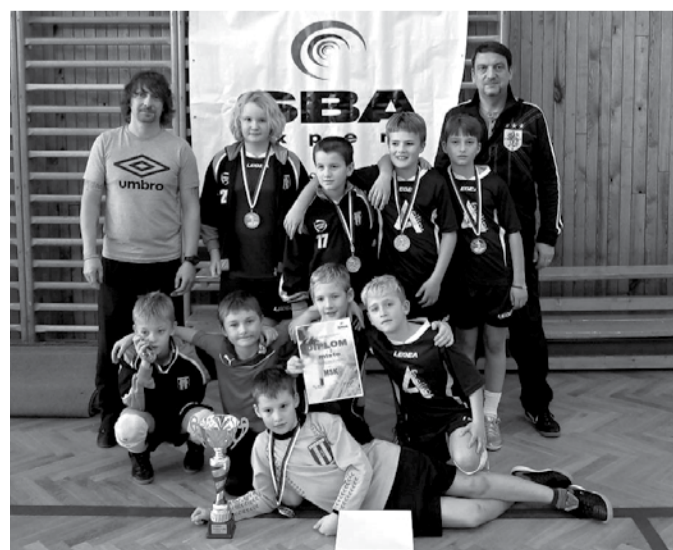
Tým přípravy MSK obsadil druhé místo. O první se ale rval do poslední chvíle. Na snímku se svými trenéry i vzácnou trofejí.