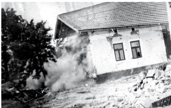
Sesuvu se bude v květnu ve městě věnovat konference Akademie věd ČR.