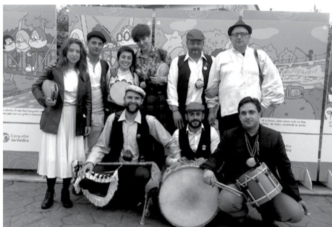
Kapela Sons da mina pochází z galicijského Fontaa, ale na Mníchovohradištsku není žádným nováčkem. Vidět ji mohli především obyvatelé Veselé.

Sons da mina v překladu znamená Zvuky z dolu. V názvu kapely z galicijské obce Fontaa se odráží místo, které po staletí zajišťovalo obživu tamních obyvatel – totiž wolframové doly. Tímto vzácným kovem