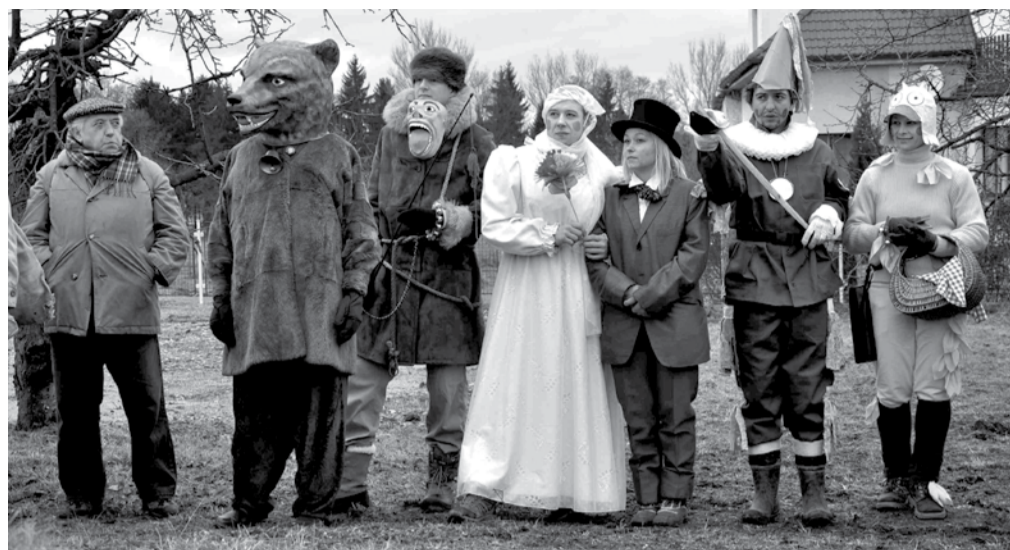
Po obnově masopustní tradice se Veseláci vydali tradiční cestou a připomínají klasické lidové masky.

Ukončení a zhodnocení akce bude probíhat záhy, ještě tentýž den od 19 hodin, v klubovně u hasičů.