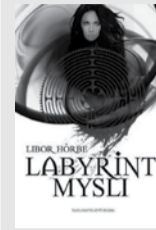
LIBOR HÔRBE: LABYRINT MYSLÍ

Knihovnice Jana Jedličková opět vybrala pro čtenáře Kamelotu několik zbrusu nových knižních titulů, které jsou k dispozici v městské knihovně. Necháte si doporučit četbu na dlouhé zimní večery?