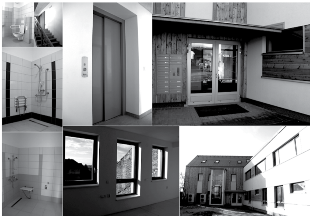
Bytový dům zvláštního určení vznikl přestavbou a přizpůsobením dřívějšího hospodářského stavení..

Postupnou proměnu, kdy se k zemi nejprve porouchaly staré hospodářské budovy, aby na nich vyrostla moderní novostavba, mohli sledovat ti, kteří pravidelně projíždějí Veselou. V těsné blízkosti hlavní silnice vznikl bytový dům zvláštního určení, jenž byl v druhé polovině ledna slavnostně otevřen. Ten usnadní život lidem se sníženou schopností pohybu.