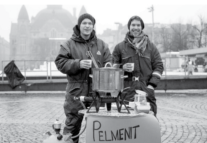
Restaurant Day je celosvětovým fenoménem. Je libo třeba pelmeně?

Zhruba desítky kuchařů ve stejném čase na jednom místě Vás na jednu únorovou neděli osvobodí od vaření. Vezměte s sebou své blízké, kamarády a sousedy a vydejte se do tepla sálu uprostřed náměstí provoněného dobrotami. Tuhle společnost si bude pochvalovat nejen Vaše duše, ale i žaludek, jenž v onen den rozhodně bude mít z čeho vybírat. Vstup volný.