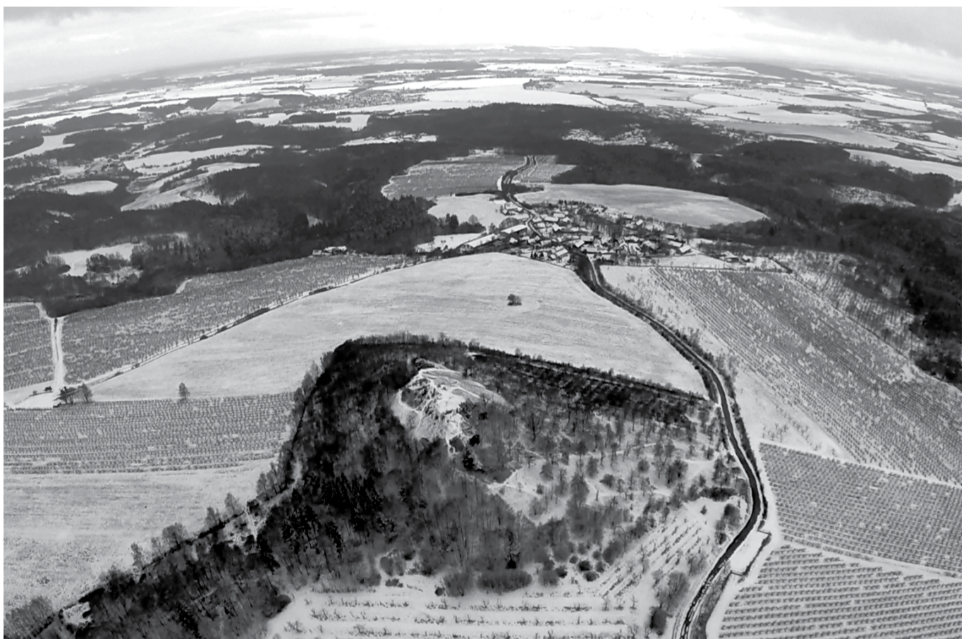
Pohled na Mužský z ptáčích perspektiv. V popředí vrchol hory, zhruba ve středu snímku obec Mužský.