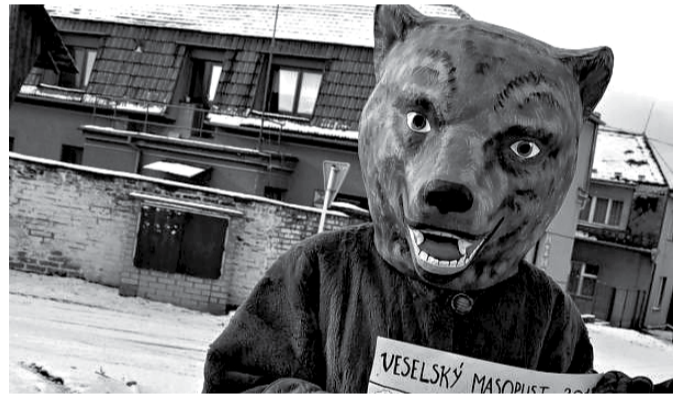
Veselský masopust je velkolepým návratem k tradicím.

Tradiční společenská událost, kterou zahájí tři císaři, s jejichž svolením se vydá obcí průvod plný tradičních maškar. Od 19 hodin následuje zhodnocení a zábava v hasičské klubovně.