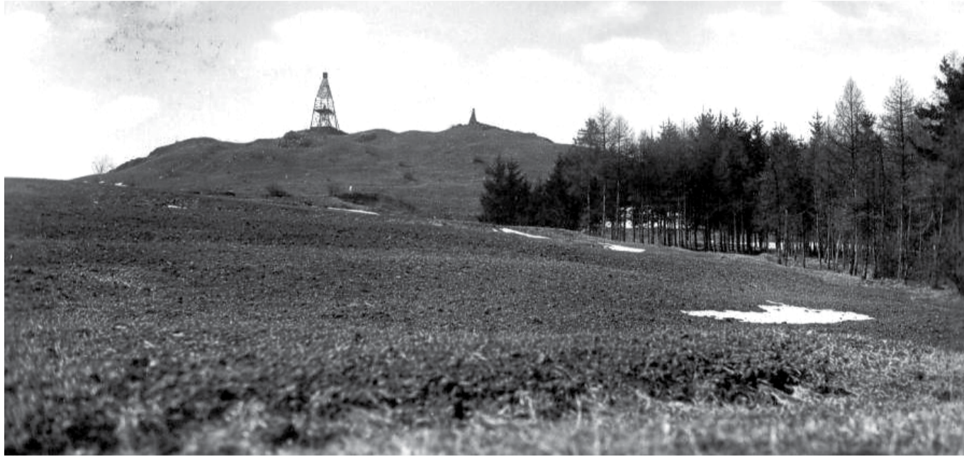
Geodetická triangulační věž na vrcholu. Dobový snímek.

Vznik Příhrazských skal, mezi něž Mužský patří, lze vystopovat až v druhohorách. V dobách, kdy se po některých částech zeměkoule proháněli dinosauři, pokrývalo náš kraj moře. Pískovcové skály Českého ráje jsou vlastně „zkamenělým“ mořským dnem. K výrazným geologickým procesům došlo ve třetihorách, kdy byly tyto mořské nánosy vyzdvíženy a rozlámány sopečnou