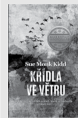
SUE MONK KIDD: KŘÍDLA VE VĚTRU

Fiona pracuje jako soudkyně Nejvyššího soudu a při svém mimořádném pracovním vytížení vnímá manželův zálet s mladší ženou, na který mu přijde, sice bolestně, ale zároveň pragmaticky. Na nějaká hluboká řešení prostě nezbyvá čas. Řeší totiž komplikovaný právní spor – sedmnáctiletý mladík umírá na leukemii a rodiče odmítají transfuzi krve, patří ke Svědkům Jehovovým. Soudkyně v precizně vedeném sporu potvrdí, že právo na život je víc než právo rodičovské.