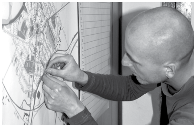
Názory lidí město sbíralo i prostřednictvím takzvané pocitové mapy.