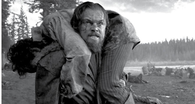
Dočká se letos Leonardo DiCaprio za roli ve filmu Revenant Oscara?