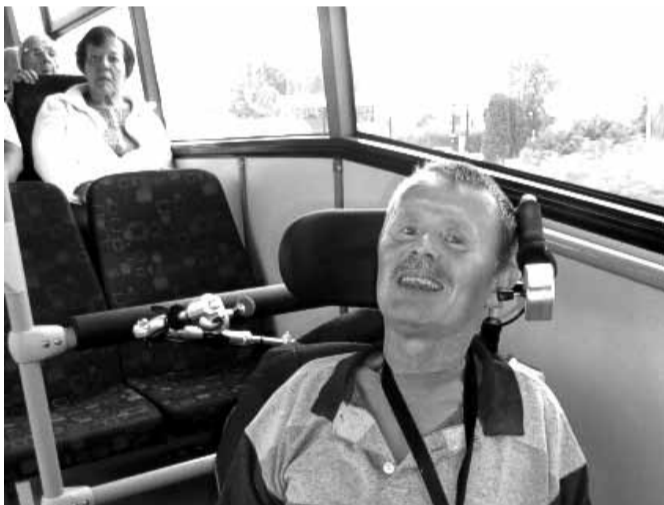
Z výletu po Českém ráji nízkoprahovým autobusem.