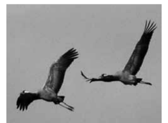
Vyplašení jeřábi z Žabakoru letí do bezpečí.

„I matka příroda doložila loňský abnormálně teplý rok troubením jeřábů už koncem prosince,“ řekl vedoucí rybářského střediska u Žabakoru. „Běžně tento jev můžeme očekávat tak začátkem března, ale letos jsme byli opravdu zaskočení.“