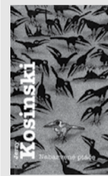
JERZY KOSINSKI: NABARVENÉ PTÁČE