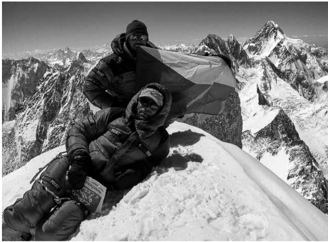
Chvilu sladkého odpočinku v cíli.

Radek Jaroš je náš nejspěšnější himalájský profesionální horolezec. Je to specialista na expedice o malém počtu členů a výstupy absolvuje výhradně bez použití kyslíkového přístroje a pomoci výškových nosičů. Během své horolezecké kariéry postupně stanul na všech osmitisícovkách, 14 nejvyšších horách naší planety v Himaláji a pohoří Karákoram. Poslední, čtrnáctou, osmitisícovku K2, úspěšně zdolal v roce 2014, a zapsal se tak do síně slávy světového horolezectví. Stal se teprve patnáctým člověkem na světě,