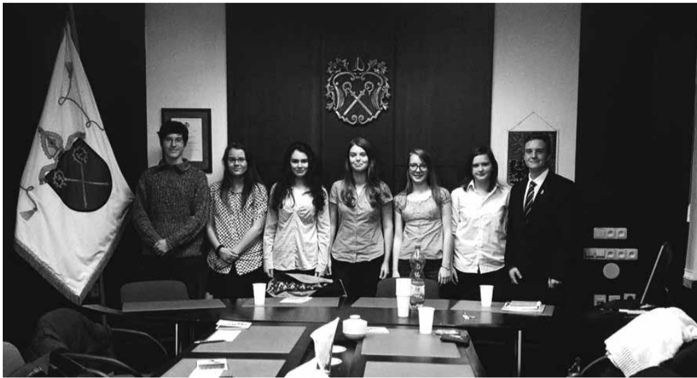
Tým městského parlamentu dětí a mládeže bude letos realizovat své první vlastní projekty.

Právě v Klubu dětí a mládeže se nový studentský parlament schází každý druhý čtvrtek v 15:30 hodin, zde pracuje na svých nápadech a po malých kouscích se snaží zlepšovat