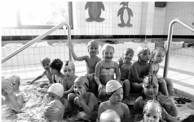
Ve vodě, to je nám hej. A nevdají nám ani koupací čepice.