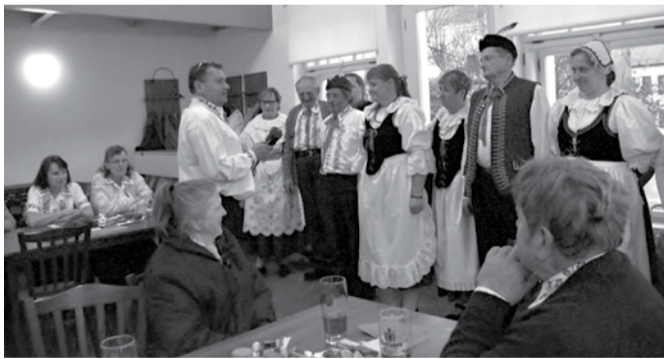
Výroční členské zasedání ve Volnočasovém centru.

Při zdejší Obci baráčníků působí i soubor Tetičky Krákorky, který letos vystoupil například při zahájení Adventního putování v sale terénu v zámeckém parku a ještě vystoupí ve farní zahradě během opakování vloni vydané akce Balonky pro Ježíška (12. prosince během Vánočního jarmarku).