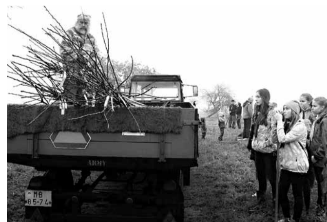
Luboš Dvořáček připravuje pro pracanty stromky, které rychle ubývají.