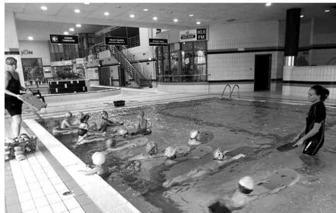
Osvojit si základy plavání dětem pomáhaly instruktorky i pomůcky.