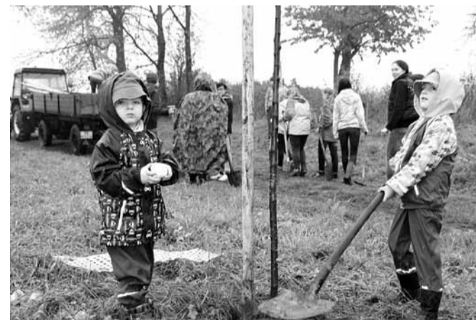
Do práce se s vervou pustily děti, které na brigádu dorazily s rodiči.