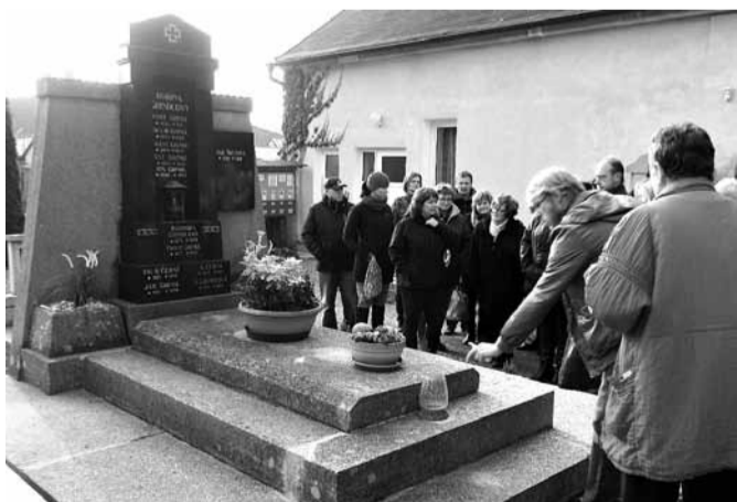
Zastávka u hrobky rodiny Grindlových.

Na sobotu 24. října připravili pracovníci Muzea města Mnichovo Hradiště procházku po místním hřbitově s názvem Významní zesnulí. Jak název napovídá, smyslem bylo uctít památku těch osobností, které v našem městě žily a pracovaly, pro město a jeho obyvatele mnohé vykonaly, a přesto o nich většina našich současníků mnoho neví.