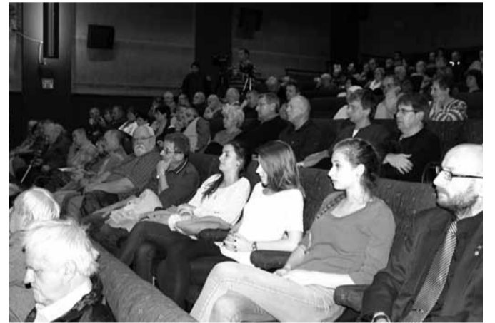
Sál kina byl zcela obsazen. Několik přichozích se muselo spokojit s místem na schodech, někteří zůstali stát.