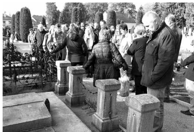
Letošní dušičková procházka se setkala s mohutnou účastí.