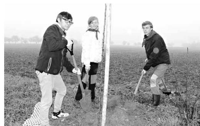
Nejpočetnější organizovanou skupinou na akci byli skauti.