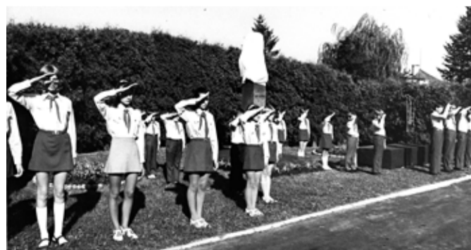
Odhalení busty Jana Švermy před školou nesoucí jeho jméno. Rok 1974.