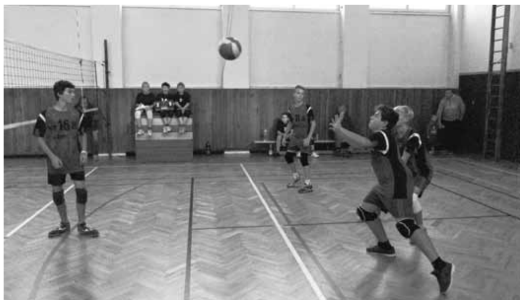
Reprezentanti Mnichova Hradiště přijímají míč.