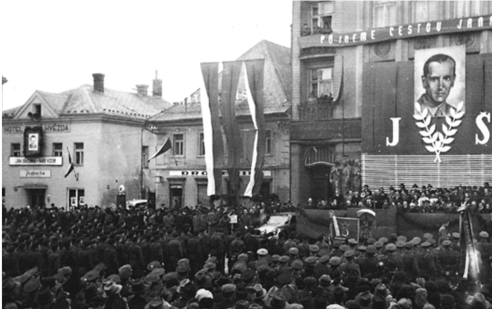
Panichida na mnichovohradištském náměstí v roce 1949.

Dá se říci, že samotné okolnosti Švermova úmrtí v listopadu 1944 při ústupu před německými vojsky v Nízkyh Tatrách hovořily pro uctění památky jeho života. Šverma, funkcionář komunistické strany ve vysoké pozici, v meziválečném období poslanec Národního shro-