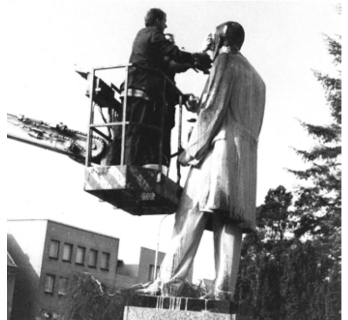
Omývání sochy Jana Švermy.

čího lidu, ale také jako vhodný příklad hodný následování mládeže. Je příznačné, že pomník vytvořený k 30. výročí smrti Jana Švermy byl odhalen před školou, kde čestnou stráž při jeho odhalování tvořili mladí salutující pionýři. Typ Švermy, ideologa a mluvčího proletariátu, byl pak ztvárněn o dva roky později v soše na náměstí.