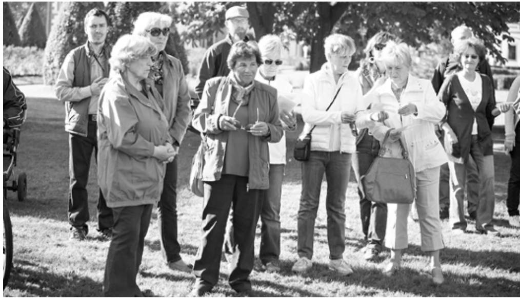
Účastníků Dne architektury se každoročně schází víc a víc.

O vazbách krajiny historické a moderní se dále diskutovalo na aktuálně žhavém místě za Orlí branou. Památkářka městského úřadu Lenka Zikmundová názorně ukazovala souvislosti barokní krajiny, plánování alejí, cest a dvorců a současné památkové zóny. Moderní pojetí tohoto prostoru zase představil architekt Zdeněk Rychtařík, zpracovávající projekt výstavby za zámeckou zdí. Na problematiku z pohledu města a kvalitního veřejného prostoru nahlížel architekt města Mnichovo Hradiště Jakub Chuchlík. Spolu