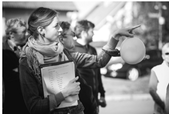
Procházku po městě komentovalo hned několik architektů.

Stalo se zvykem, že Spolek rodáků a přátel Mnichova Hradiště občas uskuteční svou schůzku v městském muzeu. V minulých letech členové spolku rádi zavzpomínali u fotografií z našich sbírek a pomohli nám řadu záběrů datovat či identifikovat některé osoby zachycené na snímcích. Tato forma spolupráce pokračuje i nadále. V letošním roce jsme ale „rodáky“ seznámili i s jinými materiály.