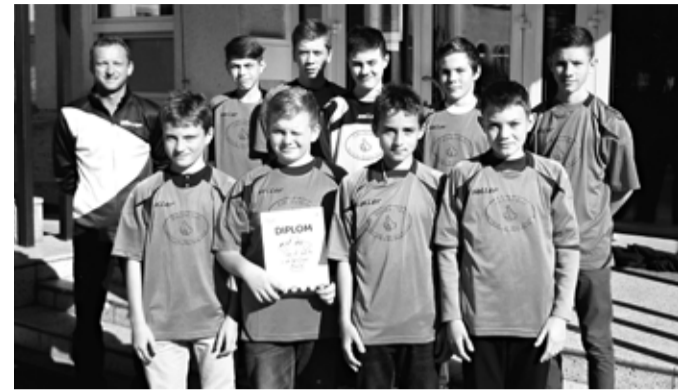
Úspěšní reprezentanti Základní školy Sokolovská.

Celkově druhé místo v okresním kole bereme a můžeme za reprezentaci školy a města poděkovat