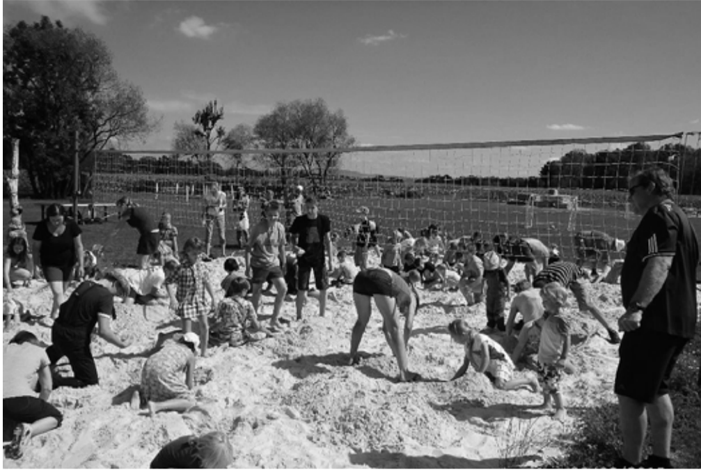
Plážové hřiště se proměnilo v lidské mraveniště. Stačilo říct, že se v písku ukrývá překvapení.

Hned poté byly děti svolány na pískové hřiště, kde si mohly vyhrabat předem zakopané překvapení. Hřiště se po chvíli změnilo v malé