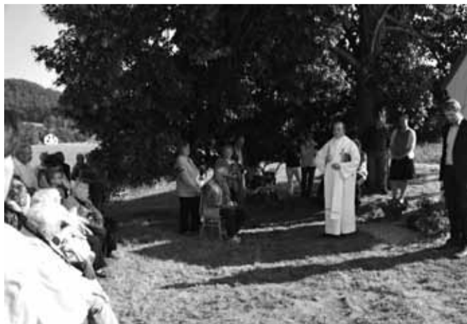
Na místě promluvil starosta i děkan, pak následovalo občerstvení.