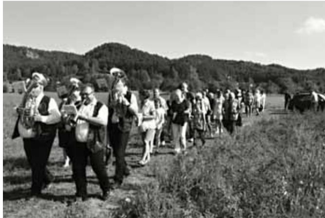
V čele průvodu se k opravené kapličce vypravila dechová kapela.