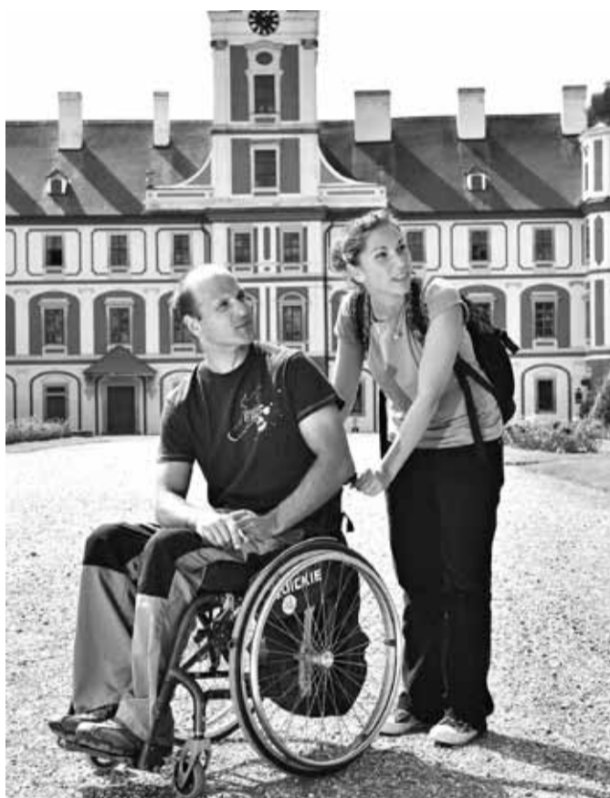
Díky iniciativě sdružení Český ráj se region stává přístupnějším.

Do oblasti Mnichovohradištska je konkrétně směřován výlet Za Lotrandem do loupežnické skrýše, který vás zavede na místa, kde vznikaly pohádky Rumpelcimprcamlr, Lotrando a Zubejda, Panna a netvor nebo Deváté srdce, tedy mimo jiné na Valečov či do zahrad mnichovohradištského zámku, oblíbených destinací filmařů.