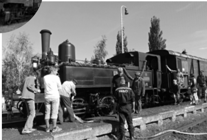
Doplňit vodu pomohli „Babičce“ bakovští hasiči.

kem bohužel nevydali, takže oficiální uvítání starostou Mnichova Hradiště Ondřejem Lochmanem si užil jen vlakem dorazivší místostarosta blíz-