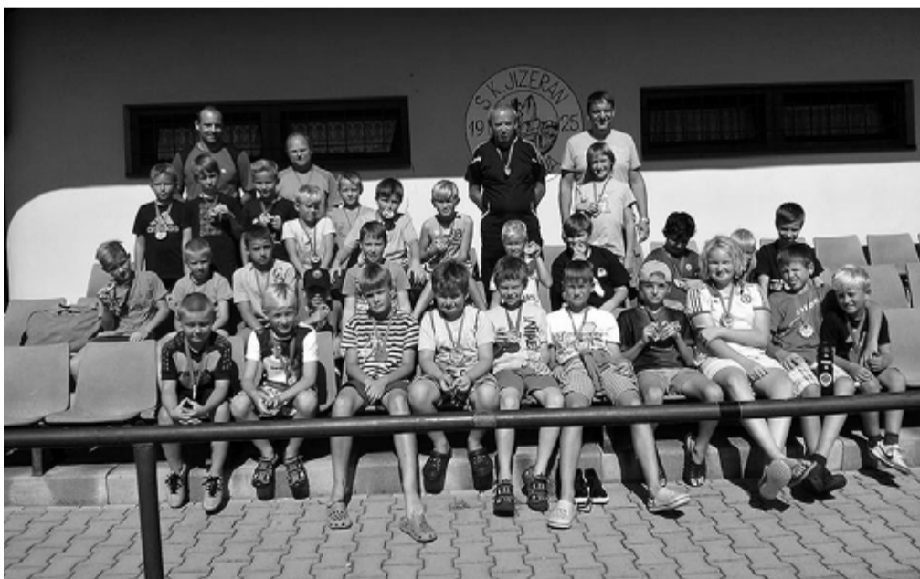
Mladí fotbalisté MSK našli na hřišti v Doubravě ideální zázemí.

V rámci bohatého programu se hráli minižáci a mladší žáci pět fotbalových zápasů s Kněžmostem a Doubravou, ze kterých odešli vždy vítězně. Povedené soustředění se zúčastnilo čtrnáct mnichovohradiš-