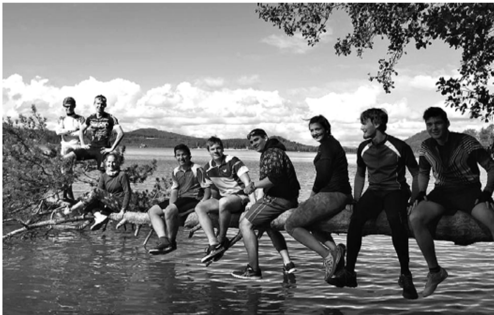
Studenti ze septimy a 3.A absolvovali vyčerpávající sportovní pobyt v Bezdědicích.

Je pátek 11. září a já a část mé třídy stojíme vyčerpání, ale šťastni opět před budovou gymnázia v Mnichově Hradišti. Právě končí cyklistický kurz, kterého se zúčastnily třídy septima a 3. A. „Když jsem tu stál v pondělí, netušil jsem, že si cyklák tak moc užiju,“ říká jeden ze spolužáků a já s ním nemůžu nesouhlasit.