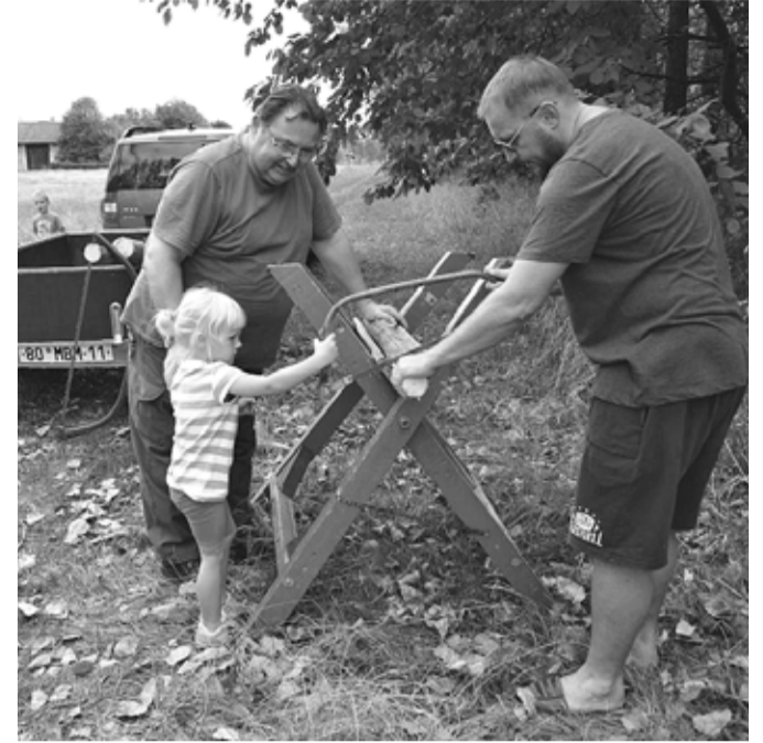
I ty nejmenší je třeba zocelovat od útlého věku.