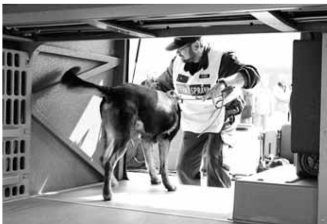
V úložném prostoru autobusu.

Dějištěm mezinárodní konference celních kynologů, která se konala od 7. do 12. září v České republice, bylo také letiště v Hoškovicích. Celníci z USA, Ruska, Ukrajiny, Polska, Gruzie a celé řady dalších zemí sem na závěr konference následovali své české protějšky, aby byli svědky toho, jak Češi pracují se služebními psy přímo v terénu.