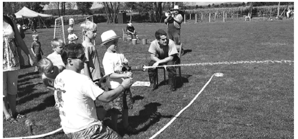
Střelba na cíl. Někteří se nechali v teplém počasí zasáhnout i dobrovolně.