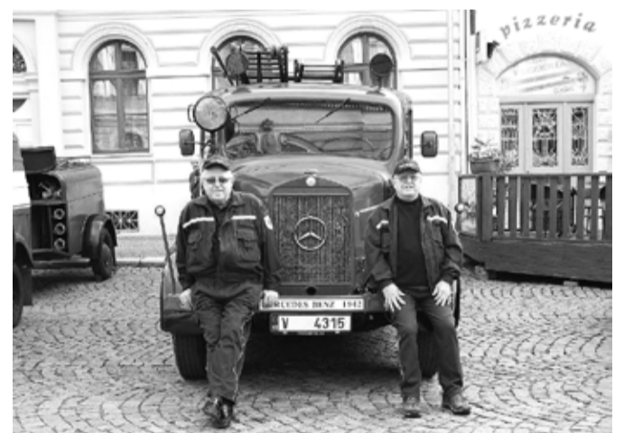
Automobilová stříkačka Mercedes Benz z roku 1942, chlouba místního SDH.