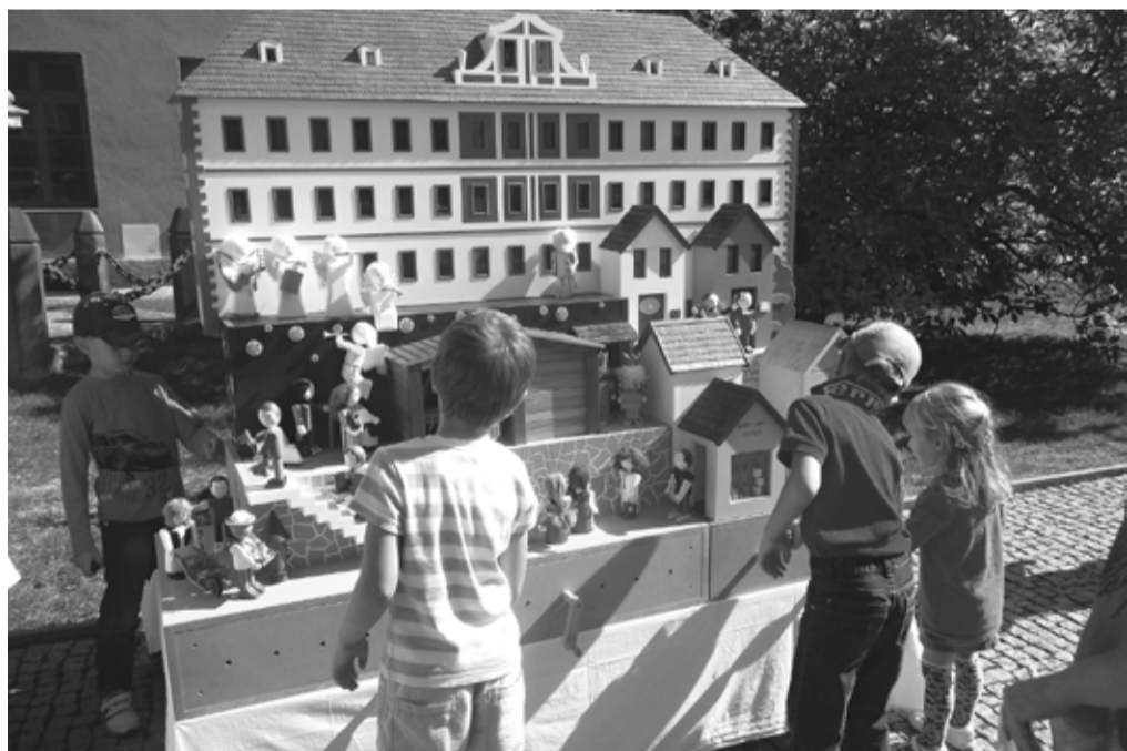
Na mnichovohradištském betlému se stále usilovně pracuje.

Hodně spoluobčanů nás jistě zná, jen si nedávají dohromady naše výtvary s Jednotou bratrskou, která po 378 letech od popravy Václava Budovce z Budova opět v Mnichově Hradišti svobodně působí.