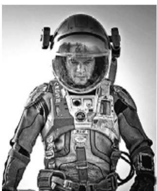
Žhavou novinkou letošního října je vesmírné drama Mart'an.

Pro zatím malou návštěvnost víkendových dvojprojekcí se budeme přizpůsobovat zájmu diváků a aktuální nabídce filmů a omezíme jejich počet. Dále nebudeme pravidelně