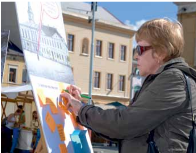
Místní připomínkali, jak má vypadat Masarykovo náměstí po revitalizaci.

Velká scéna byla umístěna před kostelem sv. Jakuba, kde vystupovalo několik kapel či jednotlivců, například rocková skupina Nastarykolena nebo Janovec jazz band přímo z Hradiště. ...3