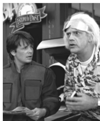
Do kina se v říjnu vrátí legendární Návrat do budoucnosti I a II.

V úterý 20. října od 18 hodin vás zvedne na cestovatelskou přednášku