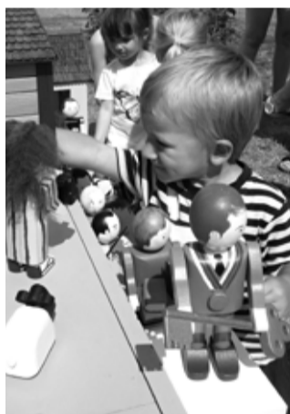
Své místo už má i starosta.

Střechy totiž pokrýváme tyčkami od nanuků. Schválně, zkuste odhadnout, kolik tyček bylo potřeba jen na zámek. Pět set kusů, tisíc, nebo patnáct set? To nejvyšší číslo je správné. A to jsme tyčky půlili, takže tašek je na našem zámku 3000. I když děti