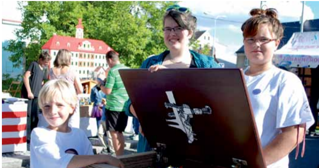
Sousedská slavnost nabídla atrakce pro děti i dospělé. Město položilo základ nové tradice

Návštěvníci Sousedské slavnosti také rozhodně netrpěli hladem. Dobré jídlo i pití zajišťovala například kavárna U Zlatníka, cukrárna Za Rohem, pivovary Klášter a Svijany a dokonce i SDH Dneboh a osadní výbor Hoškovice. Po celý den probíhala soutěž o nejlepší jablečnou pochoutku „Jablko hrani“. Po vyhlášení