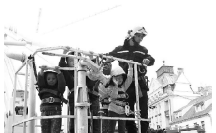
Plošina zvedala zájemce do výšky 20 metrů hodiny a hodiny v kuse.