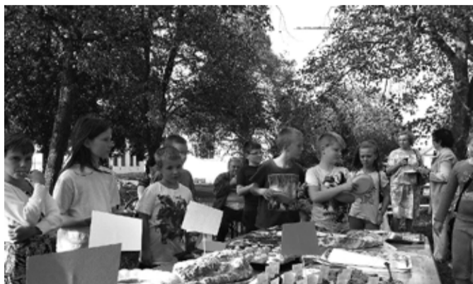
Okolo Veselé vařečky se točí každý rok celá řada dětí.