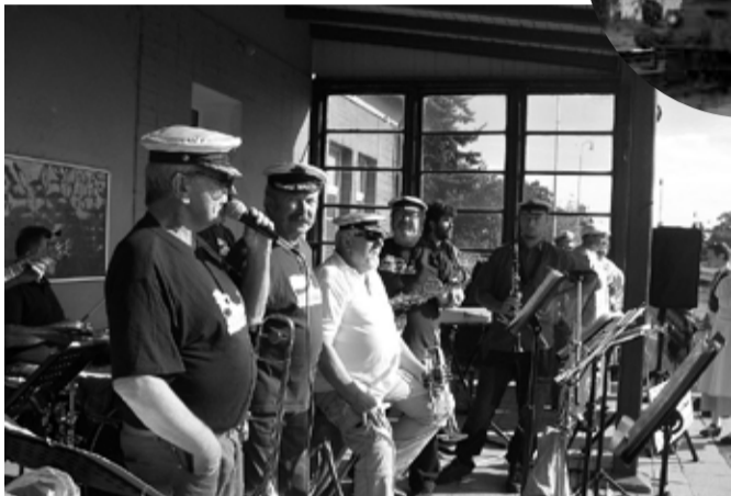
Jazz Paluba se postarala o atmosféru rušného nádraží.

lady skvěle hrála kapela Jazz Paluba střídaná místními baráčníky v krojích a dobových oděvech, kteří s harmonikářem zpívali většinou lidové pís-