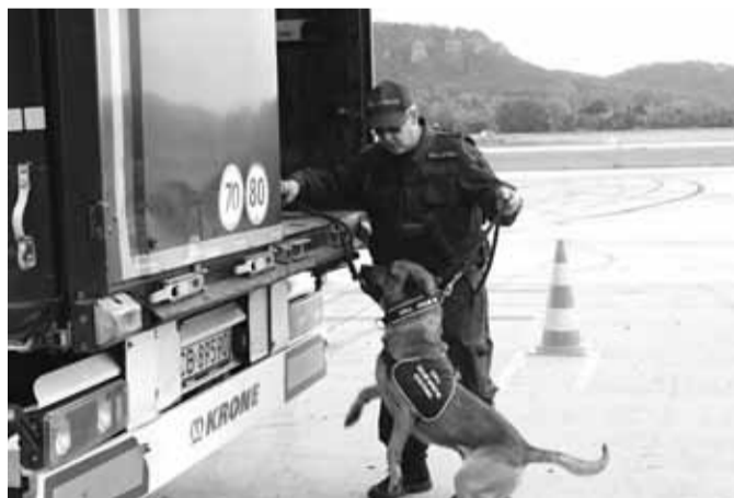
K vyšším kamionům služební psům celníci přistavují schůdky.