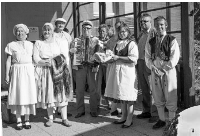
Baráčníci na nádraží hráli a zpívali.