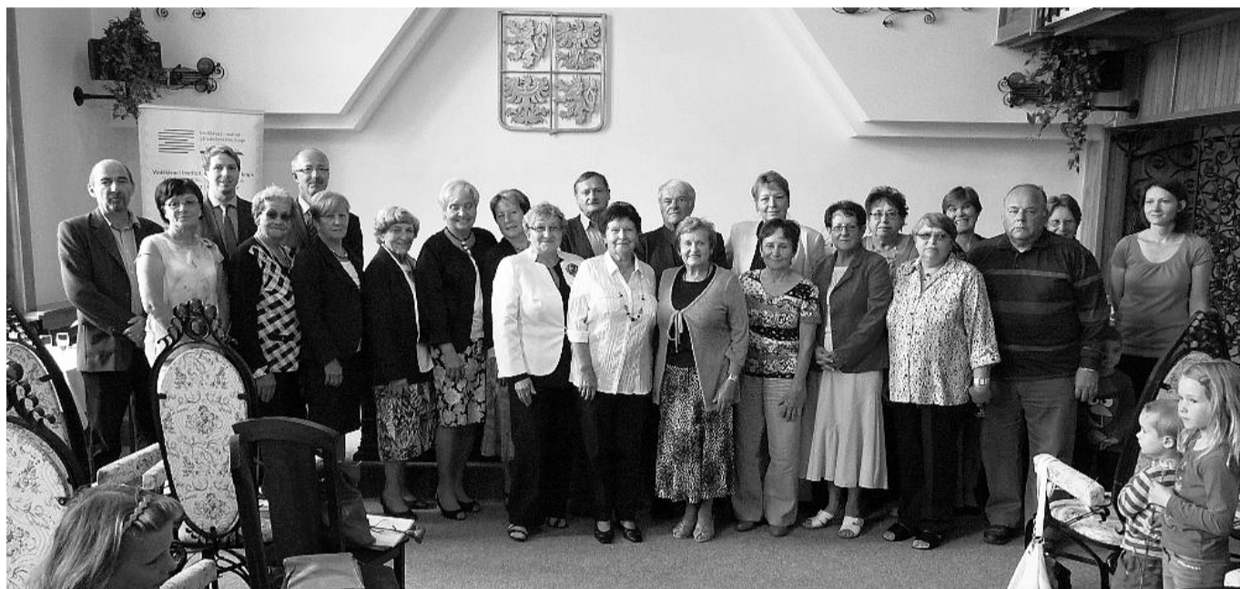
Společná fotografie absolventů prvního ročníku Akademie třetího věku, oboru Historie a kultura.