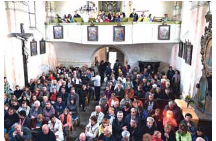
Kostel Povýšení sv. Kříže se před koncertem skupiny Spirituál kvintet zaplnil do posledního místa.

Přestože se očekávalo, že by dle předpovědi mohl déšť narušit