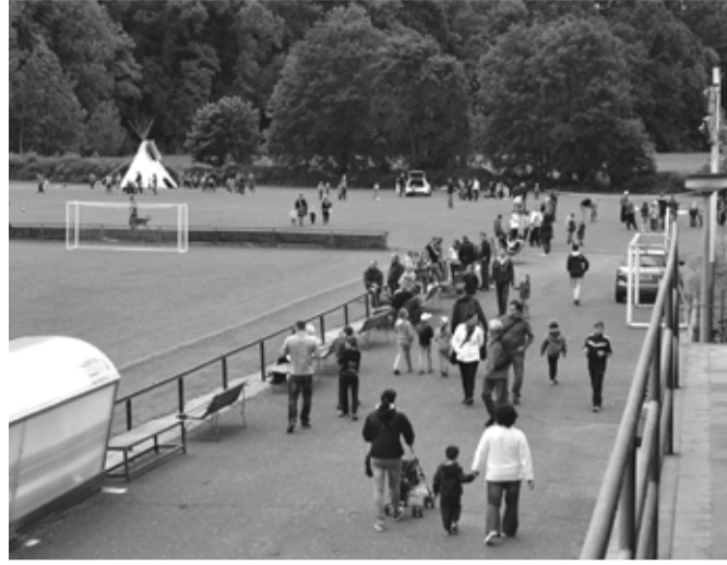
Na hřišti MSK si našlo cestu několik set lidí.

Velmi zajímavým lákadlem, které poskytl Sokol, byl pingpongový