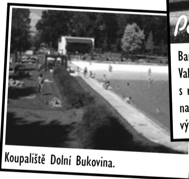
Koupaliště Dolní Bukovina.

Barokní perla, kterou nechal vybudovat Václav Budovec z Budova, je zásadním způsobem spojená s rodem Valdštejnů. Ten výstavní sídlo získal po bitvě na Bílé Hoře, kdy jej zakoupil Albrecht z Valdštejna. Zámek s rozsáhlým francouzským parkem je v létě dějištěm celé řady společenských událostí, jejichž přehled přinášíme na následující dvoustraně. Na zámku rovněž sídlí Muzeum města Mnichovo Hradiště, které zve o prázdninách na výstavu „Pražská mordparta zasahuje“ věnovanou seriálu Hříšní lidé města pražského.