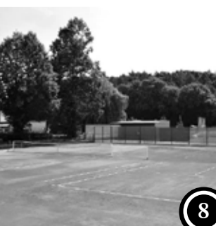
TENISOVÝ KLUB V KLÁŠTERSKÉ ULICI