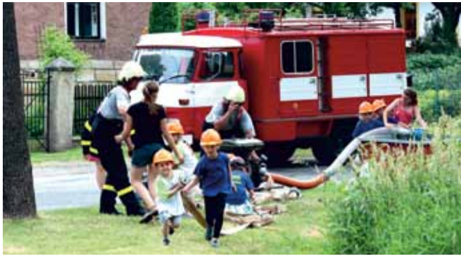
Mladí hasiči ze Sezemice v akci (nahore) a žehnání nové obecní vlajce a znaku (dole).

U příležitosti kulatého výročí byla v místní škole také zahájena výstava dokreslující obrázek života v minulých dobách. Výstava se věnuje především zásadním tématům obce – škole, hasičům, zemědělství, významným rodákům, ale také každodennímu životu vesnice. Po předchozí dohodě (tel. 604 122 918)