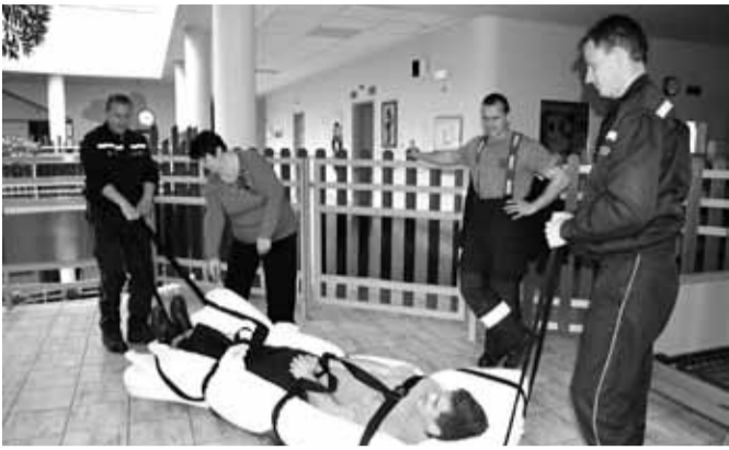
Hasiči testují evakuaci s novou podložkou.

Domov Modrý kámen, mnichovohradištský poskytovatel sociálních služeb, zajišťuje pro své klienty nejen stravování, bydlení a péči. V letošním roce jsme se zaměřili na problematiku zvýšení bezpečnosti.