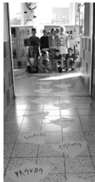
Husovy ideály připomínají hesla vylepená na školní chodbě.