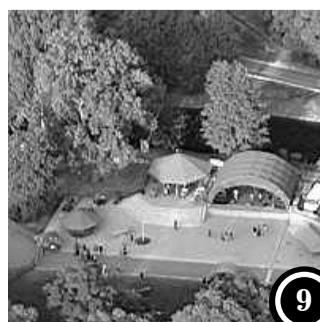
VOSTROV OPEN AIR CLUB