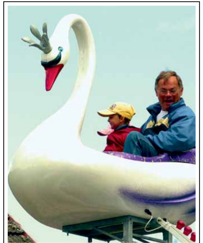
Nejoblíbenější atrakcí Veselé pouti byly létající labuť. Někteří na nich absolvovali i několik jízd za sebou. ...13