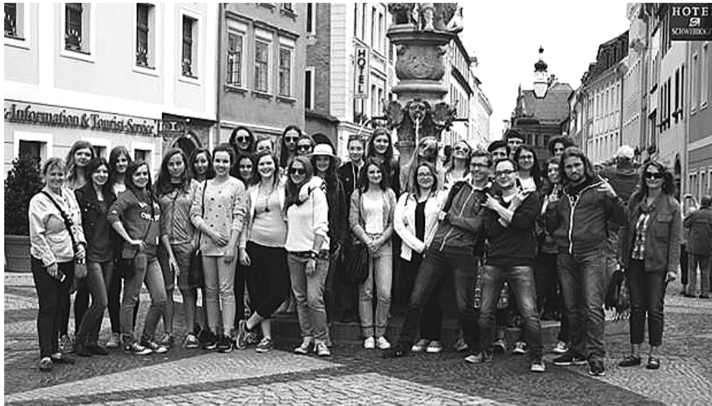
Studenti z hradištského gymnázia na skok v Polsku. Napřesrok se sem vypraví na týden.

Vyšší gymnázium se trochu drželo tradice a stejně jako minulé roky bylo na výběr z projektů jazykových, naučných, výtvarných či sportovních. Gymnázium tak dalo studentům možnost rozhodnout se, kterou dovednost chtějí rozvíjet. Konkrétně byl na výběr například pochod přes Ještědsko-kozákovský hřbet, vzájemné poznávání s Polskem, kurz první pomoci, animace, dramatizace v angličtině a další.