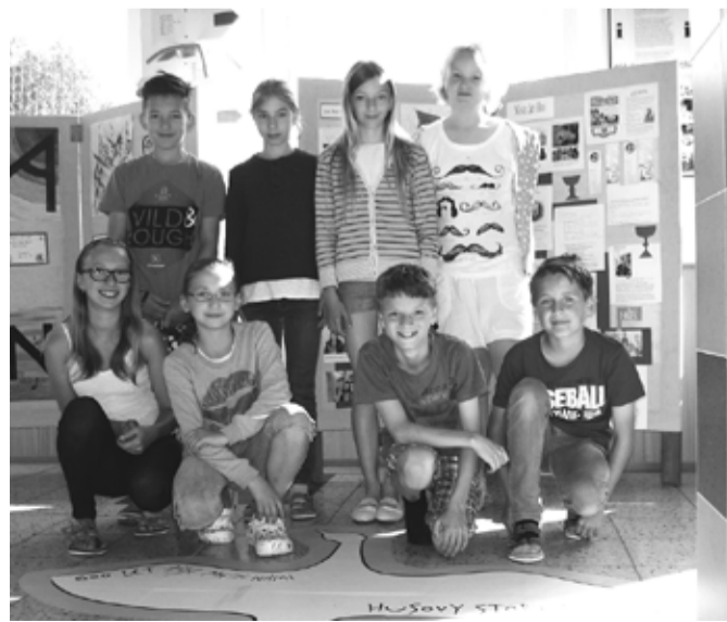
Žáci z 5. A, kteří se postarali o výlep „Husových stop“, mají už za sebou rovněž výstavu Jan Hus a jeho doba.