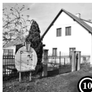
VESELÁ A STEZKA ŽIVÁ PAMĚŤ VESELSKÁ