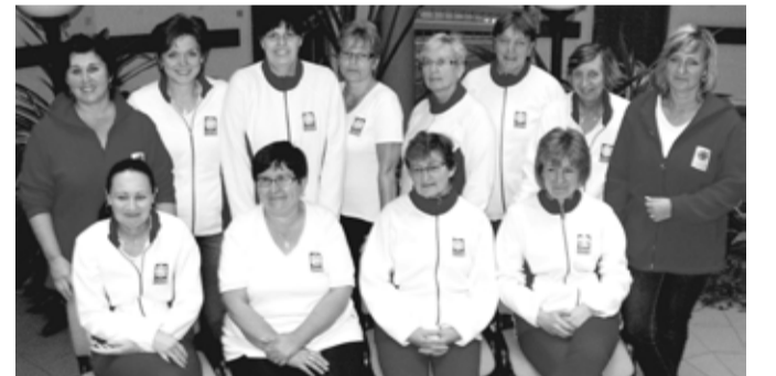
Pracovnice charitní pečovatelské služby vloni pečovaly o 126 klientů.