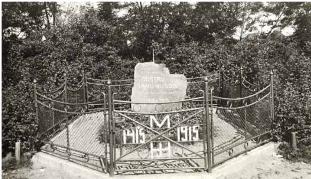
Památník Jana Husa v Mnichově Hradišti ve 20. letech 20. století.

Akce připomínající výročí Husovy smrti se konaly samozřejmě