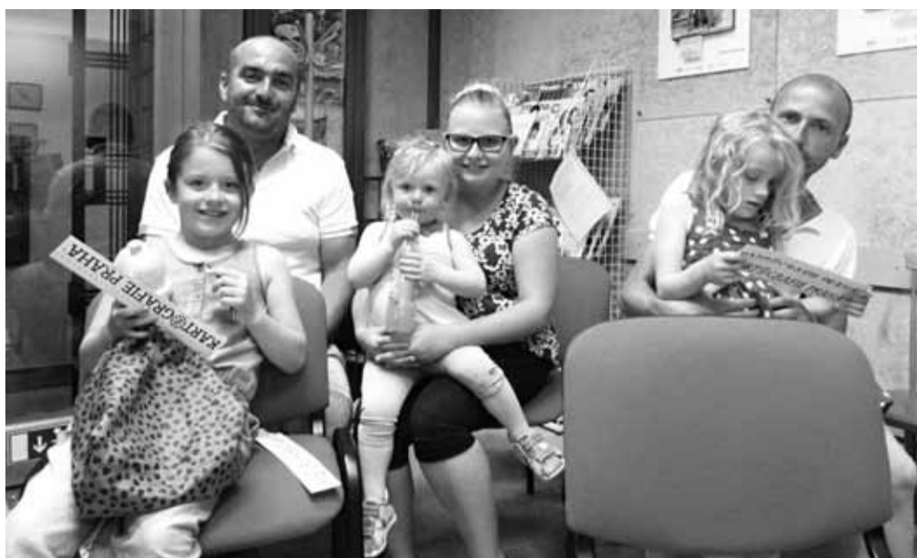
Z reakcí malých i velkých posluchačů bylo vidět, že v knihovně začala nová tradice.

Naše knihovna se tímto setkáním zároveň zapojila do celostátní akce „Týden čtení dětem“, kterou pořádá obecně prospěšná společnost Celé Česko čte dětem. Posláním tohoto týdne je „ukázat široké veřejnosti, že každodenní čtení dítěti pro radost je nejučinnější metodou výchovy čtenáře – člověka samo-