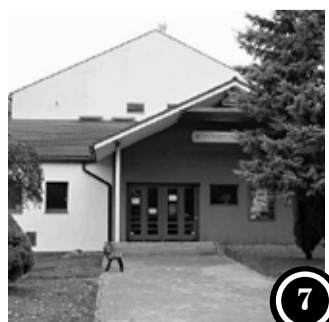
MĚSTSKÉ KINO V ULICI IVANA OLBRACHTA