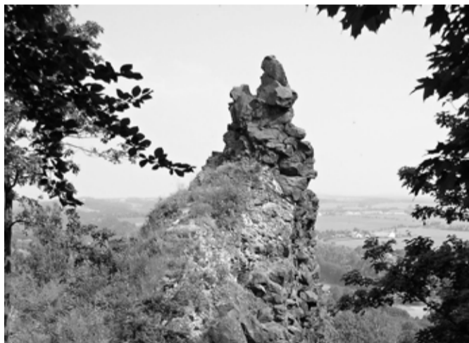
Přírodní pamárka vrch Káčov se nachází těsně u obce Sychrov a jedná se o skalní útvar vulkanického původu.

Jako každý rok ukončíme také letos letní prázdniny sportovním dnem na hřišti v Kruhách. Dopoledne 29. srpna od 9 hodin proběhne soutěž, která prověří, jak umí účastníci střílet ze vzduchovky na trase vedoucí „Po mysliveckém chodníčku“, a znalosti účastníků o přírodě a zvířatech. Odpoledne bude plné her, soutěží a zábavy a budou se vyrábět kostýmy na téma „Mladý farmář“. Den ukončíme dětskou diskotékou, na kterou naváže venkovní zábava. Přijďte si užít prima den s celou rodinou. Akcí pořádá Sportovní klub Kruhy a Myslivecké sdružení Obůrka Březina.