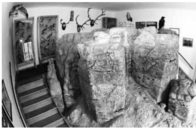
Rozměrný model Drábských světniček v muzeu.

Archeologové byli především vedeni snahou zachovat pro budoucí generace podobu tohoto skalního útvaru, neboť se obávali, že pískovcové skály by vzhledem k povětrnostním podmínkám mohly být brzy zničeny. Dále existovaly obavy z dalšího sesuvu půdy, ke kterému v těchto místech došlo už v roce 1926. Třetí důvod byl podmíněn dobou, obdobím 2. světové války.