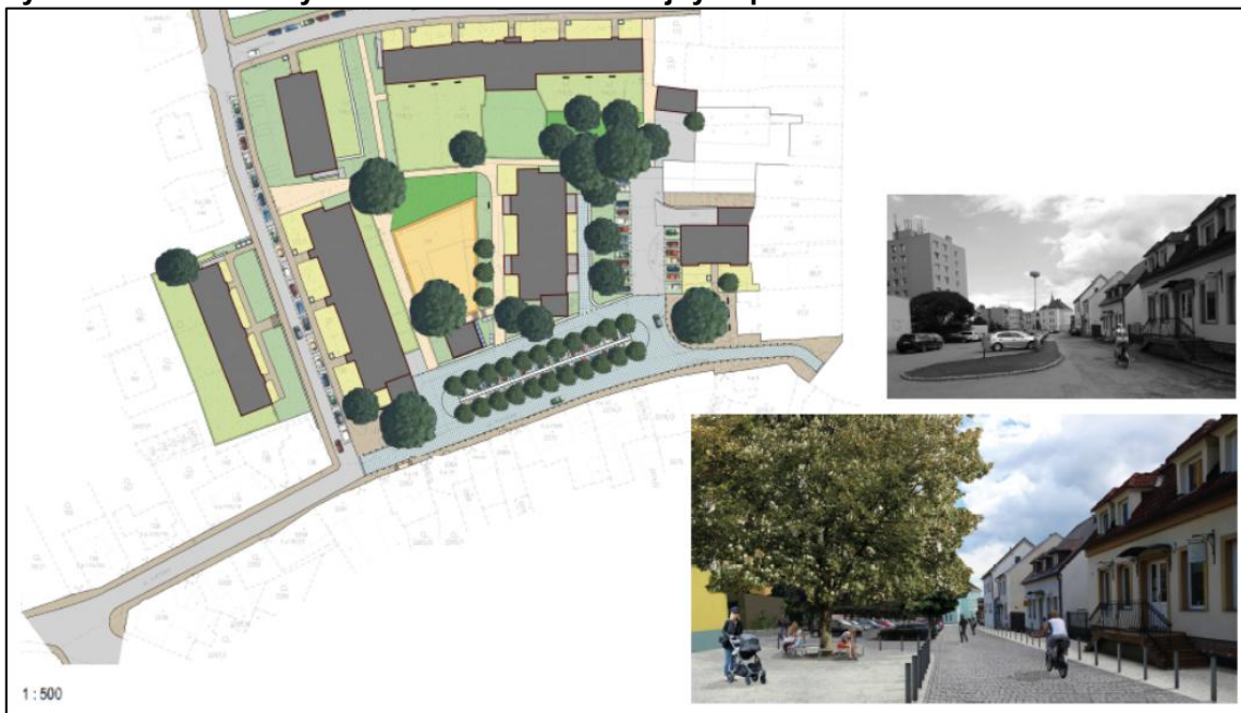
Výřez z ilustračního výkresu Územní studie veřejných prostranství Poříčská