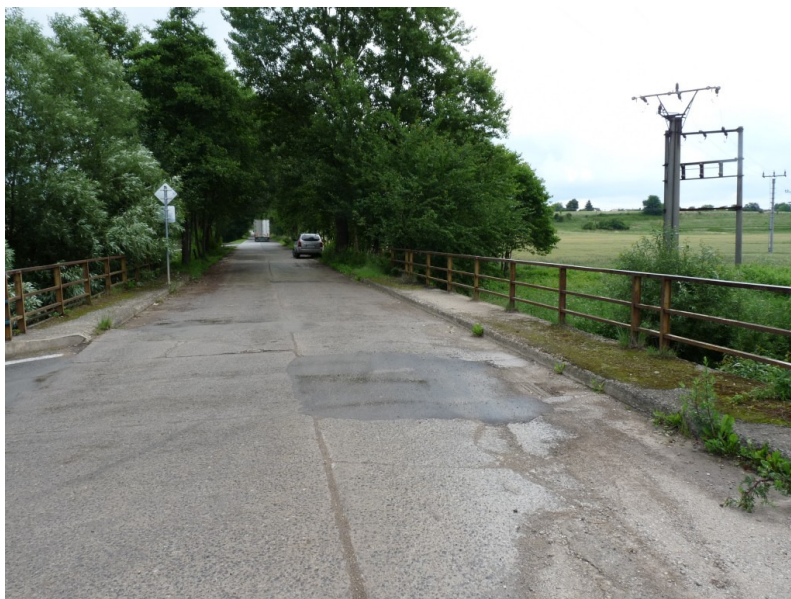
Obr.1 - Pohled na most směrem objekt č.p.217