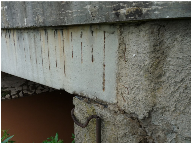
Obr.3 - Pohled na most z nátokové strany