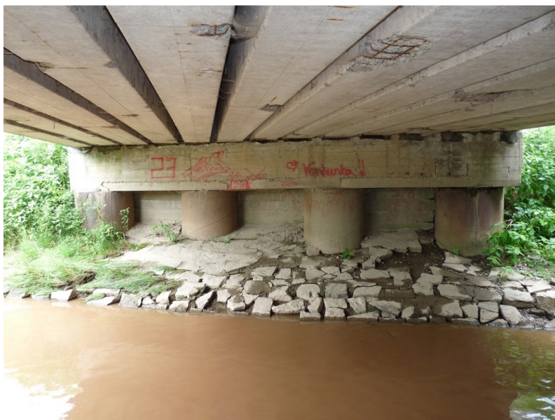
Obr.4 - Pohled na most – nosná konstrukce a spodní stavba