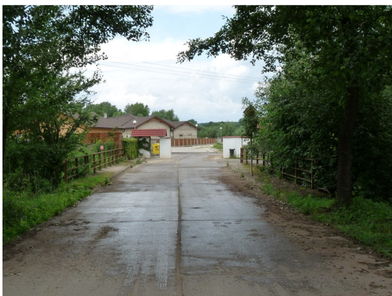
Obr.2 - Pohled na most směrem silnice III/610