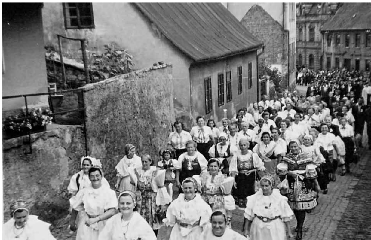
Červenec 1956, kdy se konal průvod na zámek a slavnost k 60. výročí zdejší baráčnické obce.