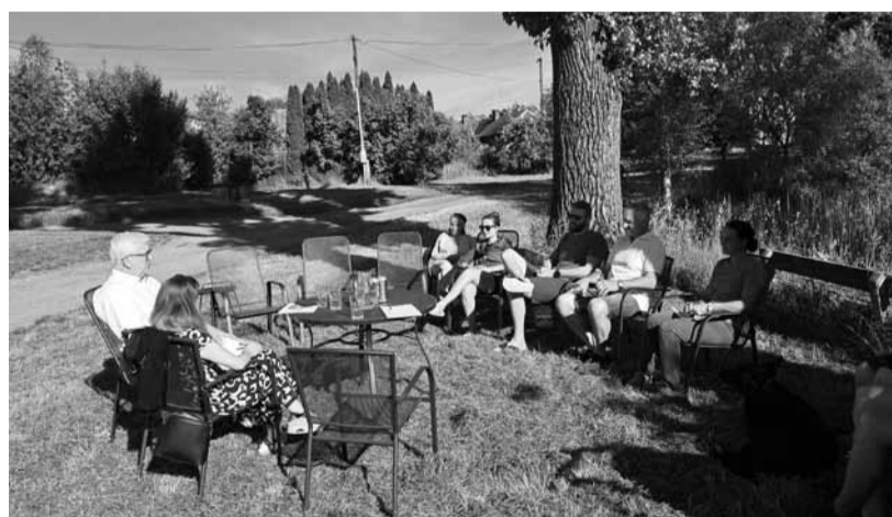
Sousedské setkání s obyvateli Hradce, nejmenší místní části Mnichova Hradiště.

Témata, která nejvíc pálí jejich obyvatele, jsou všem vesnicím společná a v čase se příliš nemění. Jedním z největších je odkanalizování a likvidace odpadních vod. Zatímco Hoškovice a Dneboh mají řešení sice ještě daleko, ale už na dohled, protože probíhají projekční práce, v ostatních místních částech je kanalizace spíše hudbou budoucnosti. Zájemci,