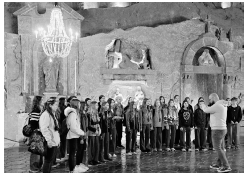
Ave verum corpus v kapli sv. Kingy v solných dolech ve Wieliczce.