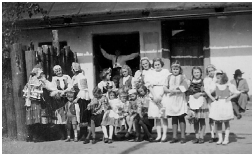
Květen 1945. Baráčníci se u své rychty pod kostelem sv. Jakuba připravují na vítání projíždějících vojáků Rudé armády (vlevo je vidět ještě část protitankového zátarasu do ul. Svatojakubské, dnes ulice 1. máje).

V době válečné (1939–1945) byl ovšem Hotel U nádraží využíván často k jiným účelům, činnost národně zaměřeného spolku tam tehdy byla nemožná. Někdy v těchto letech došlo se soukromým majitelem k dohodě o možnosti využívání místnosti ve dnes již neexistujícím domečku pod kostelem sv. Jakuba, kde v té době bývala