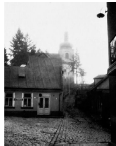
Jeden z posledních snímků domečku – kdysi zdejší baráčnícké rychty. 80. léta 20. století.

baráčnícké kronice zapsáno, že se „opravovala Rychta, tentokrát už ta opravdu NAŠE!“ Opravy to ale asi byly pouze ty nejnnutnější, výdaje zapsané nejsou. Pravdou je, že tenkrát vše fungovalo trochu jinak, než jsme zvyklí dnes, tedy stavělo se v rámci „akcí Z“ a jako materiál obvykle sloužilo to, co se kde sehnalo... Stav domečku nebyl dobrý, jak vzpomínají pamět-