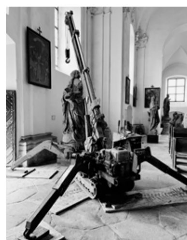
Převoz originálu sochy ze zámeckého lapidária.

sloup ozdobit ve druhé polovině roku 2027. Na zhotovení sochy přispěl Středočeský kraj částkou 400 tisíc Kč.