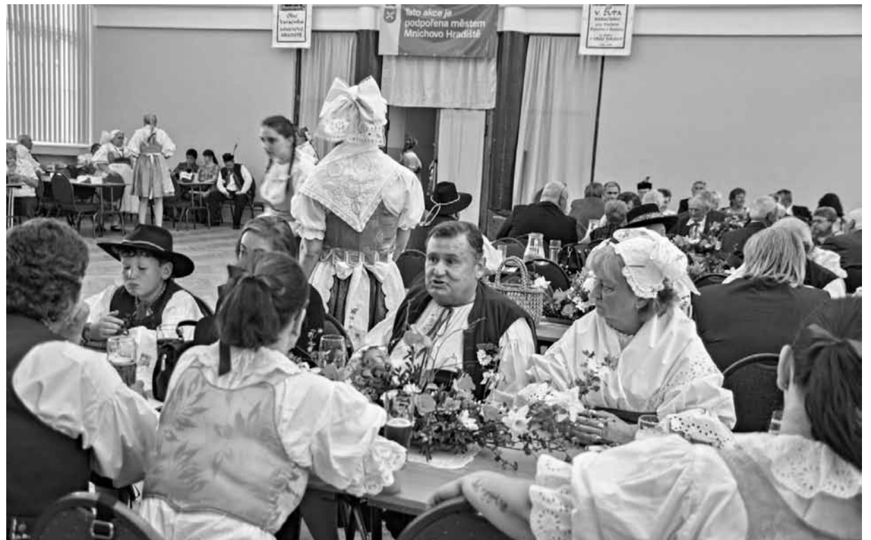
Foto z letošního Baráčníckého plesu konaného 18. dubna.