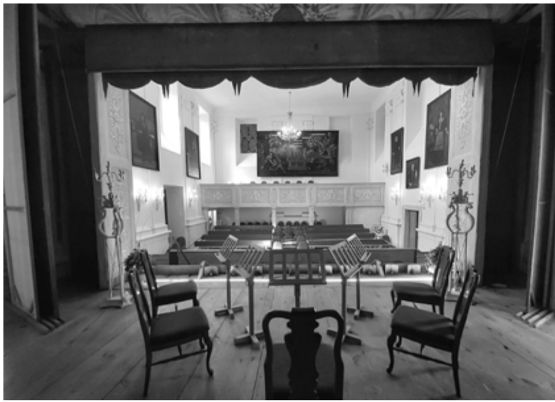
Po 12 letech se do zámeckého divadla vrátí barokní opera.

Také v letošním roce se zámek zapojuje do projektu Po stopách