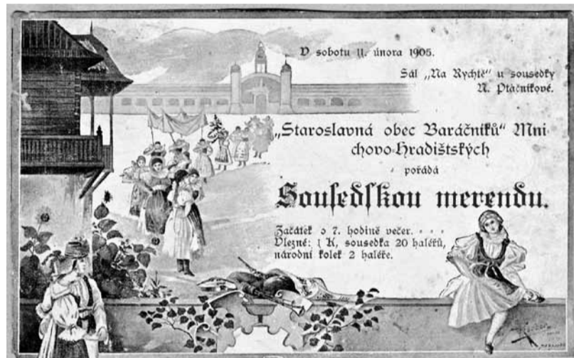
Pozvánka na Sousedskou merendu z roku 1905 (s podtištěným baráčníckým motivem ze Světové výstavy v Praze 1898, v pozadí pavilon výstaviště, vlevo baráčnícká rychta).