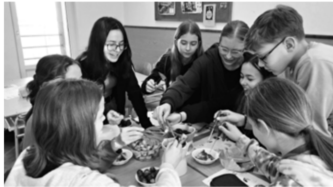
Oslava svatého Valentína po francouzsku – čokoládová fondue v hodinách francouzštiny třídy sekundy.

Studium tohoto krásného, byť nelehkého jazyka se snažíme zpestřit a Francii přiblížit různými způsoby. V minulosti studenti navštívili například Alliance française v Liberci, kde měli možnost konverzovat s rodilou mluvčí a vyzkoušet si část mezinárodních jazykových zkoušek