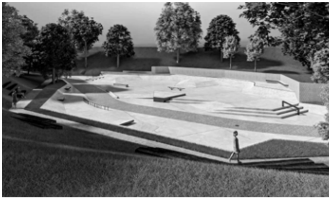
Vizualizace zamýšlené podoby nového městského skateparku. Foto: U/U Studio

Autoři ankety by preferovali přesun skateparku do zamýšleného sportovně-relaxačního areálu u Jizery. Studii záměru město představilo docela nedávno, záměr je však víceméně v plenkách – má charakter vize, která měla prověřovací charakter. Nyní probíhá prověřování možnosti rozvoje stávajících sportovišť vzhledem k vlastnictví pozemků v místě. Vzhledem k tomu, že větší pozemky mezi sportovními areály MSK a tenisového klubu a protipovodňovým valem není v majetku města, nelze o jejich využití v krátkodobém horizontu uvažovat. Výjimku představuje záměr výstavby nové tenisové haly, který se připravuje na pozemcích místních sportovních klubů. Roli zde hraje i to, že zdejší půda se nachází v 1. třídě ochrany, což i do budoucna může znemožnit realizaci větších stavebních záměrů.