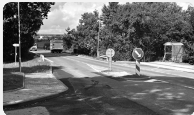
Proměna křižovatky v Dobré Vodě. Stav před a po stavebních úpravách.