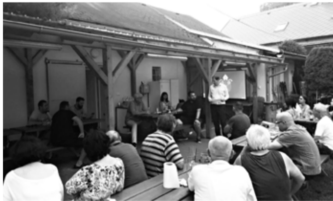
Sousedské setkání ve Lhoticích proběhlo v červnu.

Některá témata přišla na přetřes na takřka každém posezení. Například stav komunikací. Místní upozorňovali na výtluky, uvolněné kanalizační vpusti, nepěhehlné úseky, drolicí se krajnice či celkové neutešený stav konkrétních silnic.