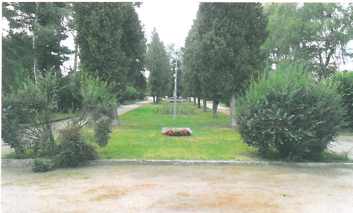
Obrázek 1 Park