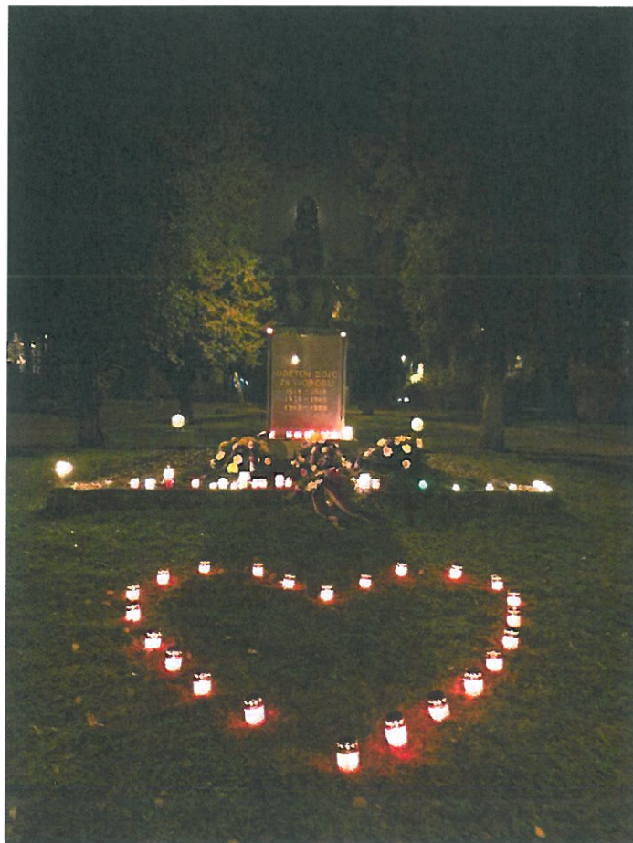
Obrázek 3 Pietní akt 17. listopadu