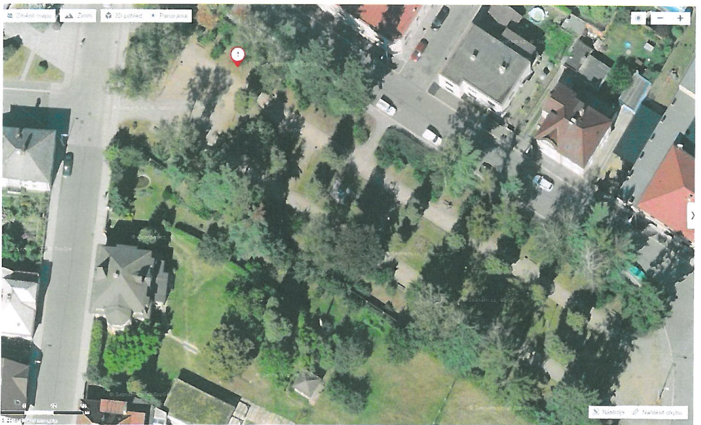
Obrázek 2 Umístění lavičky v parku