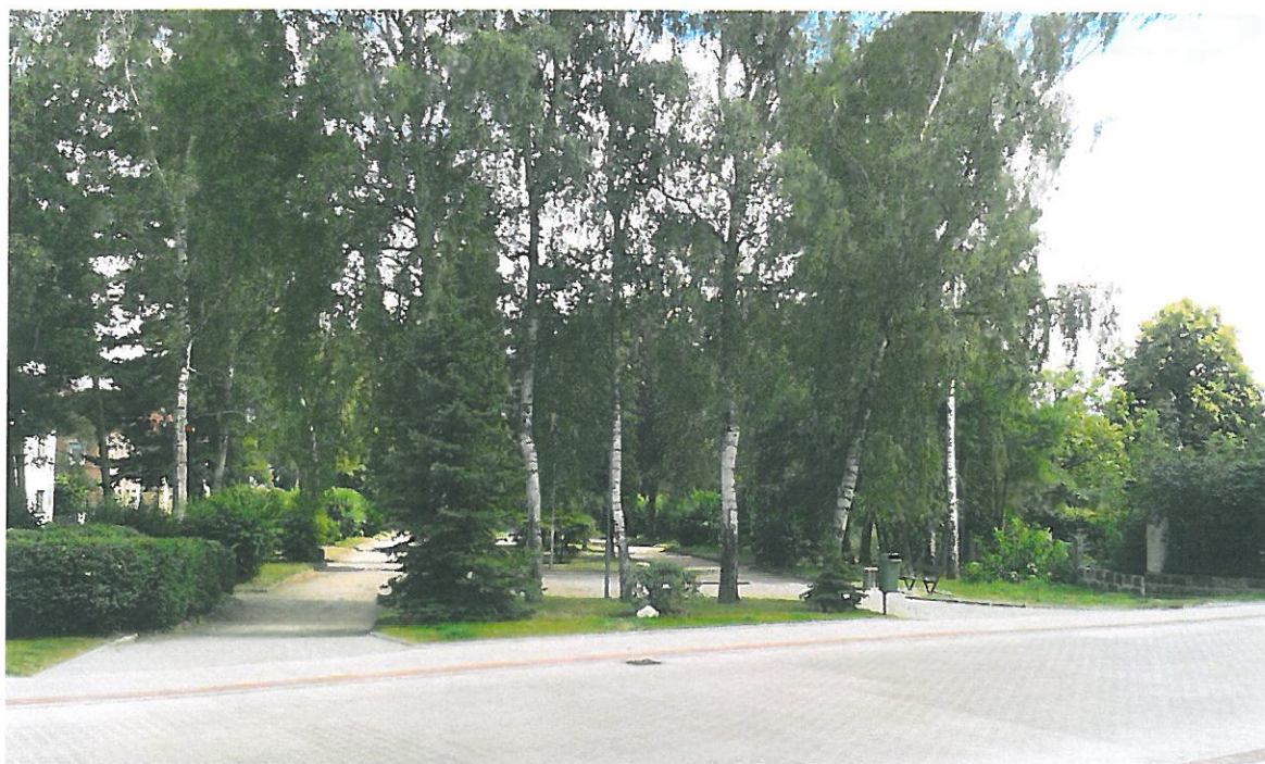
Obrázek 2 Park