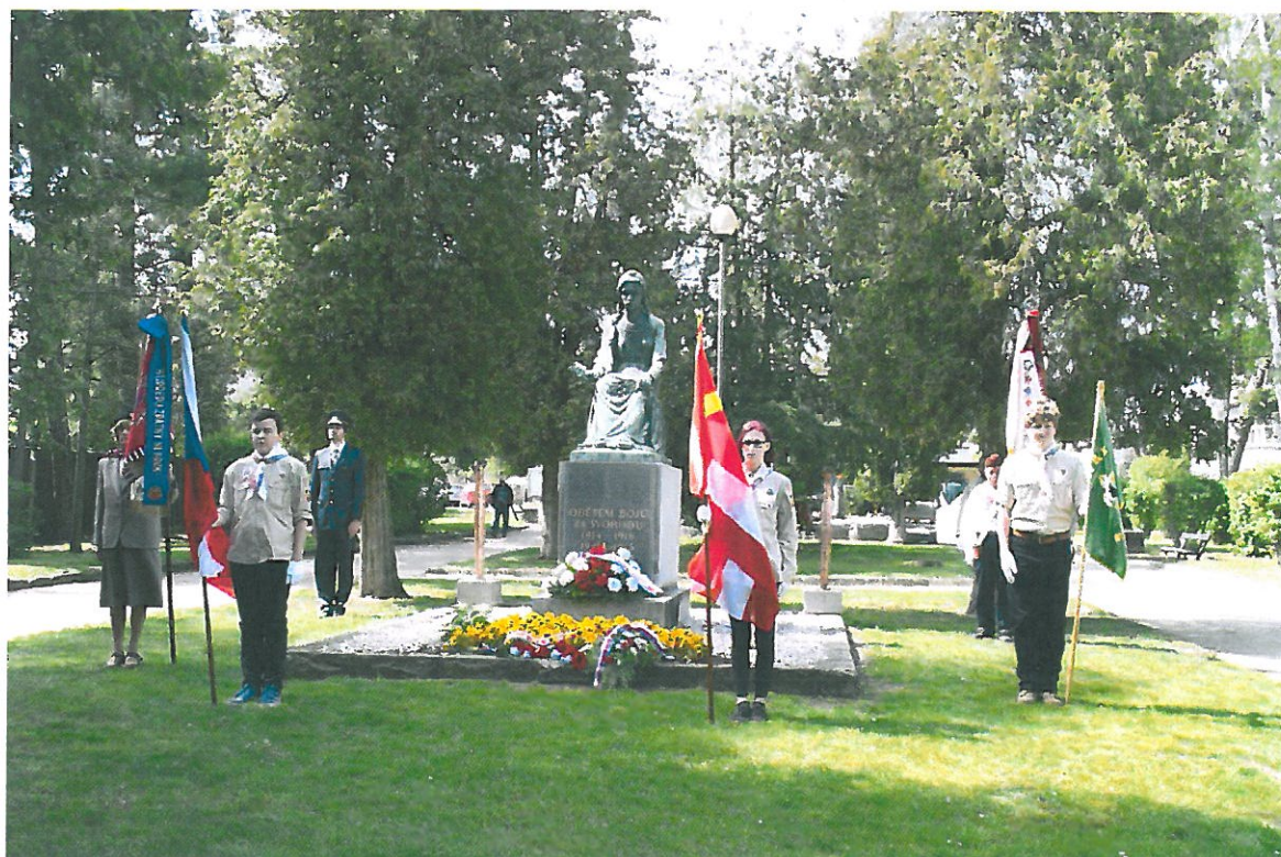
Obrázek 4 Pietní akt 8. května