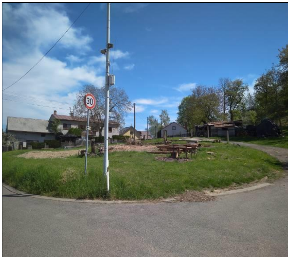
Foto zadní část pozemku nabízená ke směně

Foto přední část pozemku požadovaná ke směně