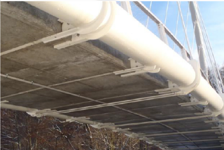
LÁVKA NA CYKLOSTEZCE "GREENWAY JIZERA" V ÚSEKU DOLÁNKY - LIŠNÝ