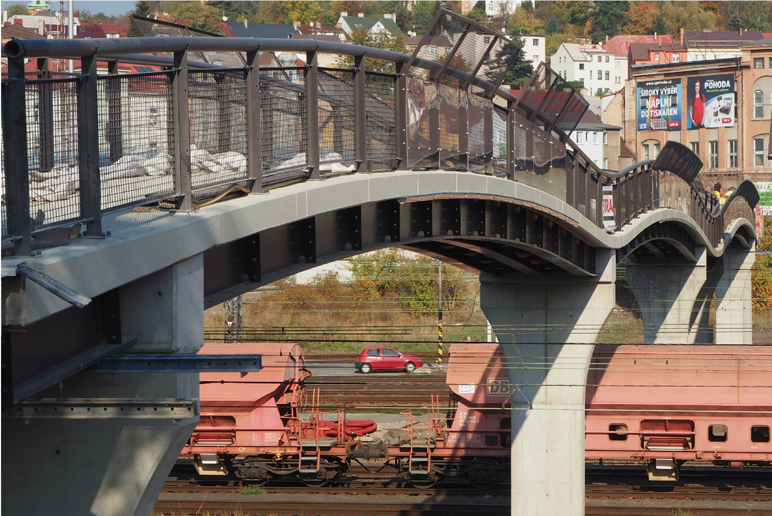
LÁVKA PŘES VÝCHODNÍ NÁDRAŽÍ V DĚČÍNĚ

KONSTRUKCE: SPŘAŽENÁ OCELOVÁ KONSTRUKCE NOSNÍKŮ S ŽELEZOBETONOVOU POCHOZÍ DESKOU