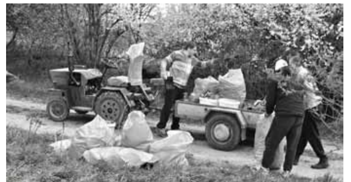
V dubnu se neuklízelo jen v Hradišti, ale i v některých místních částech.