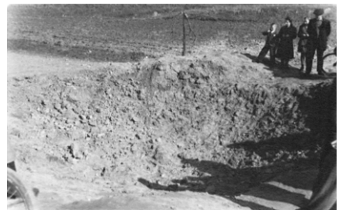
Lidé se přicházejí podívat na kráter, který vyhloubila puma u zámecké zdi.