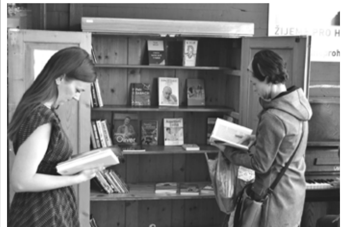
Dnes už je Knihomol naplněn knihami a slouží svému účelu.