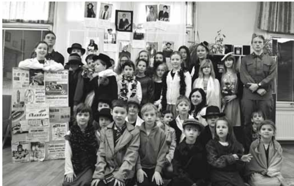
Vrahouni, pozor! Tahle parta vás dostane, i když po sobě zahladíte stopy sebelépe.