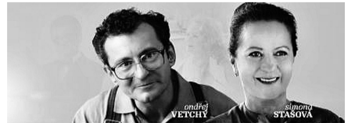
OD TVŮRČŮ filmu LÁSKA JE LÁSKA