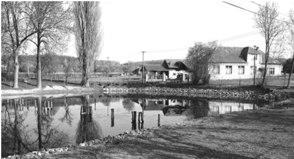
Rybník ve Lhoticích má za sebou generální rekonstrukci. Péče, které se těšil, je na něm vidět na první pohled.

Příprava zakázky se datuje již do roku 2002, kdy byl vypracován projekt „Úpravy rybníku ve Lhoticích“. V rozpočtu města ale bohužel nikdy nebyla vyčleněna potřebná částka na realizaci tohoto projektu. V roce 2011 byl přepracován a v roce 2013 bylo vydáno stavební povolení a následně i podána žádost o dotaci ze Státního fondu životního prostředí. Ta bohužel nebyla úspěšná.