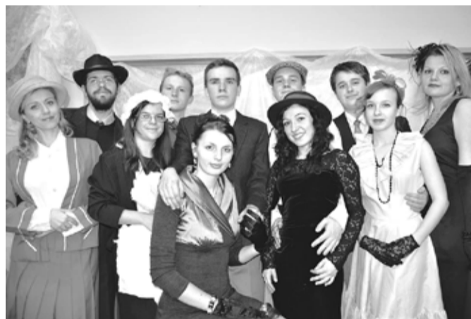
Organizátoři přespání se stali podezřelými v případě vraždy.