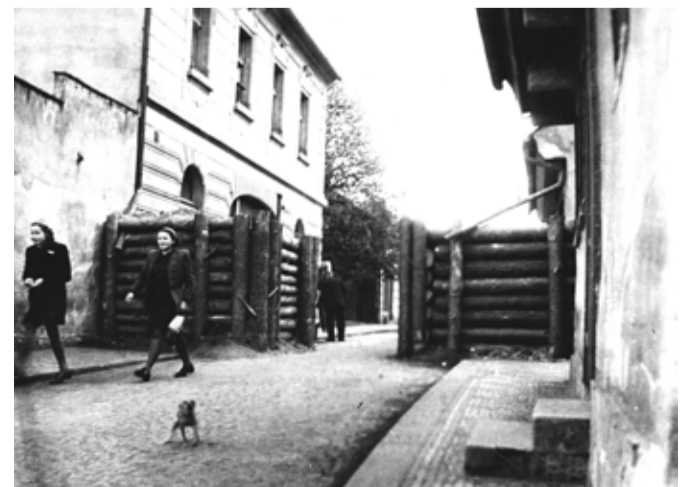
Zábrany v dnešní Havlíčkově ulici.