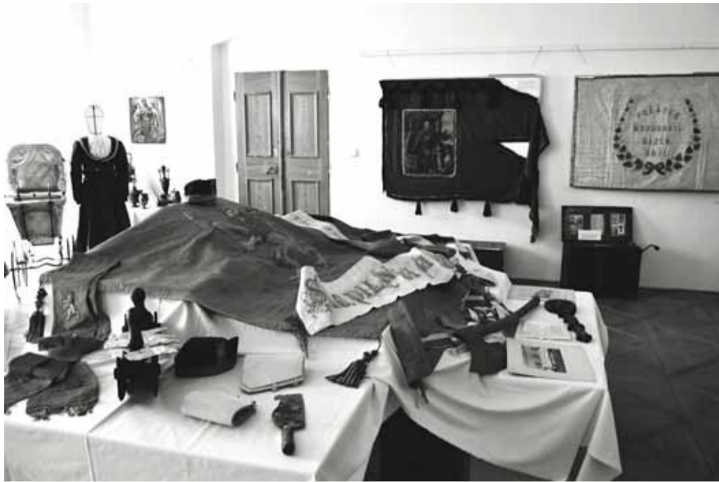
Cechovní pokladnice, prapory a další insignie se nevidí každý den.

Hned druhá v pořadí proběhla v Jičíně, v následujícím roce v Mladé Boleslavi, v Bělé pod Bezdězem nebo v Sobotce. V roce 1895 se připojil Turnov i Mnichovo