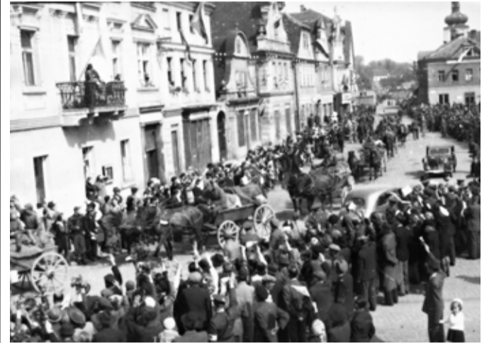
Nadšené vítání Rudé armády projíždějící náměstím s koňskými povozy.