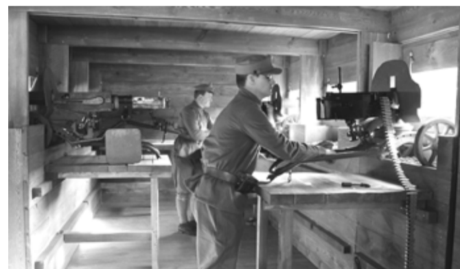
Interiér obrněného vozu. Legionářský vlak byl malou vojenskou základnou na kolech, která vojákům poskytovala útočiště celé měsíce.

Legionářský ešalon dorazí na hlavní nádraží do Mladé Boleslavi 20. května v 10 hodin dopoledne. Věnujte pozornost tomuto muzeu na kolech.