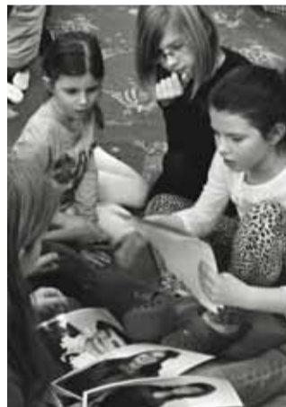
Z některých hlav se málem kouřilo.