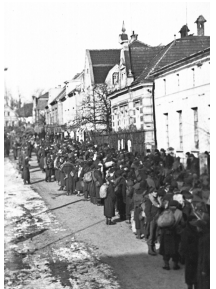
Průvod zajatců 19. února 1945 v ulici Svatopluka Čecha.