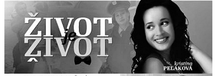
KOMEDIE JAK VYŠITÁ