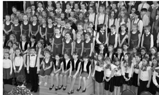
Setkání přípravných sborů minulý rok.