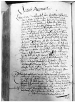
Záznam v pozemkové knize Bakova nad Jizerou z roku 1645.

Z hlediska povolání byl od počátku 18. století u velmi vysokého počtu příslušníků rodu fenomén prá-