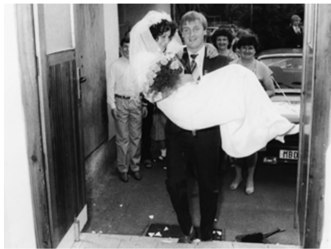
Přenášení nevěsty přes práh.

Svatba byla spojena s řadou rituálů, pověr a pověřených praktik, které měly snoubencům zajistit spokojený život a plodné (nebo v pozdějších dobách méně plodné) manželství. Některé z pověr se týkaly volby měsíce oddavek, jiné se vázaly přímo ke svatebnímu dni (oděv novomanželů, střepy jako symbol štěstí apod.). Svatební zvyky a tradice se v průběhu doby měnily, jejich podoba byla závislá také na regionu a na movitosti snoubenců. Vybrali jsme pro vás některé zvyky, které byly v regionu Mnichovohradištska praktikovány v minulosti, část z nich se však uchovala (byť v modifikované podobě) dodnes.