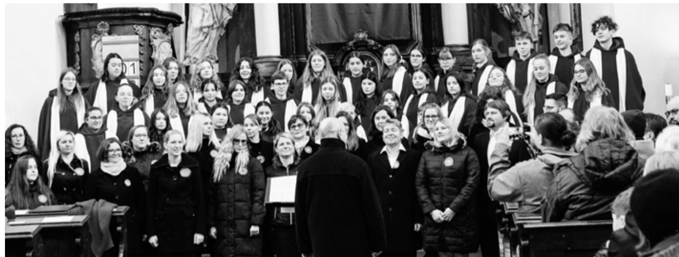
Společný snímek Zvonků a Continua v kostele sv. Jakuba před zahájením koncertu pro UNICEF.

V sobotu 16. března se v kostele sv. Jakuba uskutečnil dobročinný koncert, na kterém zazpívaly pěvecké sbory Zvonky a Continuo.