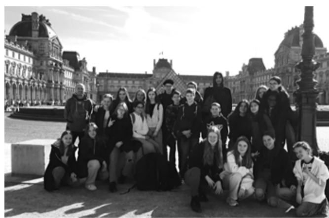
Společný snímek před Louvrem

Nevynechali jsme ani poznání francouzské školy. Naši francouzští kamarádi jsou ve Verneuil žáky Collège Jean Zay, období druhého stupně české základní školy. Jejich první hodina začíná v 8:30 hodin, sešli jsme se tedy před tímto časem před školou, kde nás překvapilo množství dětí a jejich přísná kontrola před vstupem do objektu školy. Každý z žáků se totiž musel prokázat jakýmsi sešitem vydávaným školou, kterým se identifikovali před kontrolorem. Kontrolor, betonový dvůr, strohé budovy a následně i temné chodby a třídy v nás vyvolávaly pocit vězení. Tento pocit se ještě umocnil v době velké přestávky, kterou žáci povinně tráví na betonovém dvorku za každého počasí. Zrovna přeloz, pár šťastných našlo střechu nad hlavou podél budov, zbytek byl vydán na milost a nemilost dešti. Ale evidentně to nikomu z nich nevadilo. Ruch a chaos 700 žáků byly pro všechny z nás překvapivé. Žádné mobilní telefony, to je jedno z mnoha přísných pravidel, která ve škole po celou dobu výuky i o pře-