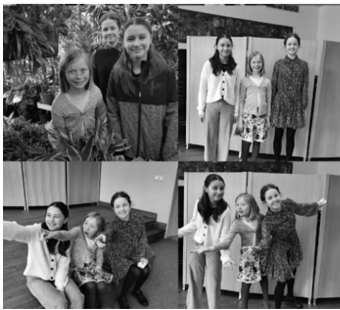
Oceněné recitátorky z literárně-dramatického oboru ZUŠ.