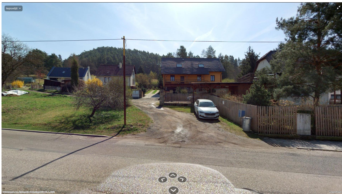
Foto oplocení vlastník 3