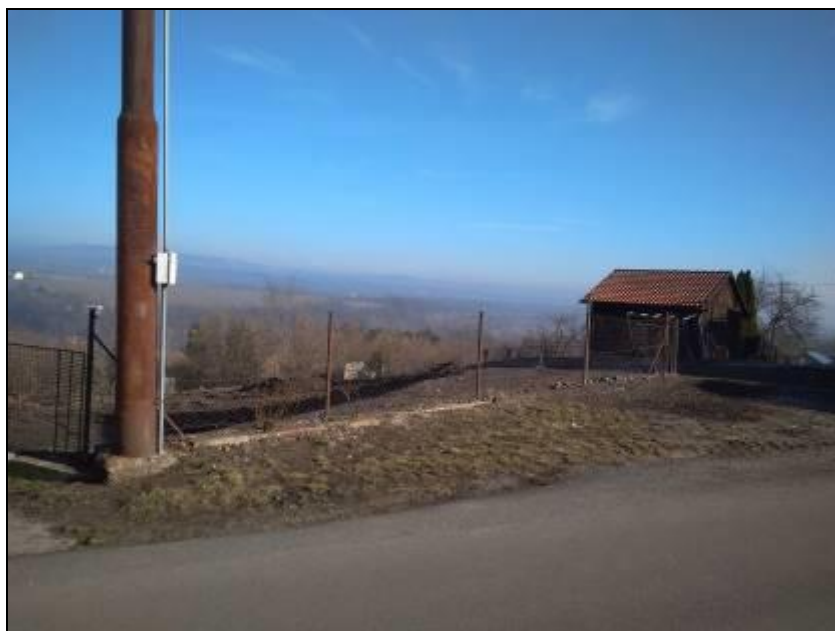
Foto před úpravou pozemku