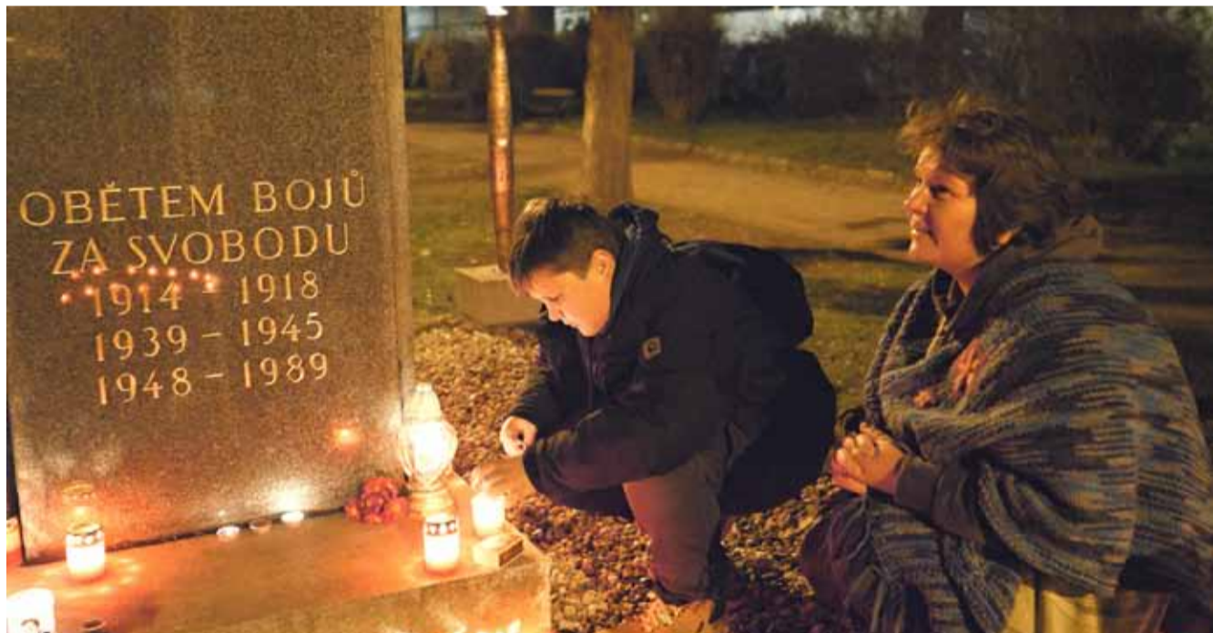
Nejvýznamnějším výročím letošního roku bylo bezesporu třicáté výročí události 17. listopadu. Na programu oslav se organizačně podílel městský úřad s místním muzeem.