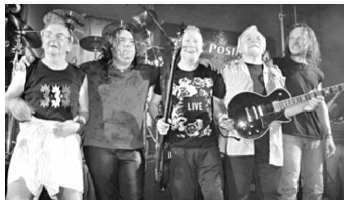
Součástí oslav 17. listopadu byl i hojně navštívený koncert legendární kapely Diskant, která plnila sály zejména v 80. letech.

Město oslovilo Petra Madera, jenž projekt laviček Václava Havla po smrti Šípka spravuje, a v lednu hodlá vypsat sbírku na 250 tisíc korun, ze které by vznik tohoto místa měl být uhrazen. Lavička by měla najít místo v parku u nádraží po jeho revitalizaci, případně na Vrchlického návrší.