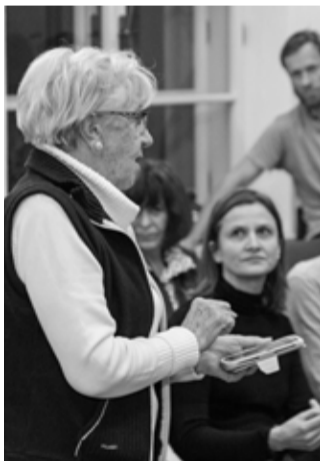
Vzpomínání na 17. listopad 1989.