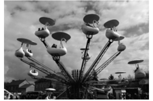
Anenská pouť přiveze do města opět řadu atrakcí.