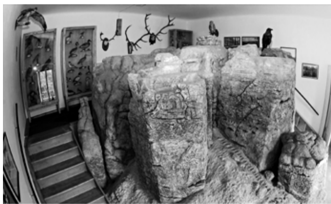
Model Drábských světíček v měřítku 1:17 na vás čeká v muzejní expozici.

Koho nezláká výstava o hospodách, ten by se možná rád podíval do stálých expozic. Zde jsou připraveny dvě novinky. Jak už jsme informovali, muzeum získalo soukromou sbírku loveckých trofejí. Vystaveno je tak v prostorách muzea několik desítek kusů trofejí dančí, jelení, mufloní a srnčí zvěře i s oceněními, která majitel získal.