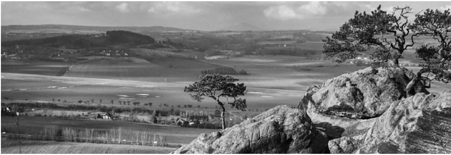
Pohled z Drábských světíček na Český ráj v okolí Mnichova Hradiště, konkrétně obec Honsob s třetíhornsou Káčovem v pozadí.