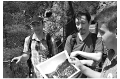
Český ráj nabízí celou řadu krásných výletů.