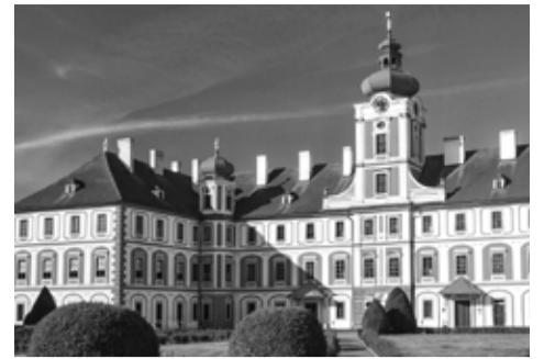
Mníchohradský zámek, rodové sídlo Valdštejnů.