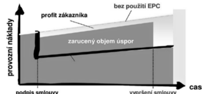
Graf naznačující princip fungování metody EPC.

Veškeré tyto úpravy byly navrženy tak, aby jejich návratnost byla maximálně dvanáct let. Jde totiž o takzvaný EPC projekt. To volně přeloženo znamená energetické služby se zárukou. Společnost ENESA s.r.o. (dříve EVČ s.r.o.) se zavázala, že díky jejímu návrhu a realizaci úsporných opatření dojde ke garantované roční úspoře v nákladech na energii ve výši 1,42 milionu Kč. Že jde o výhodné opatření potvrdila i první vyhodnocující zpráva za rok 2018, která uvádí, že