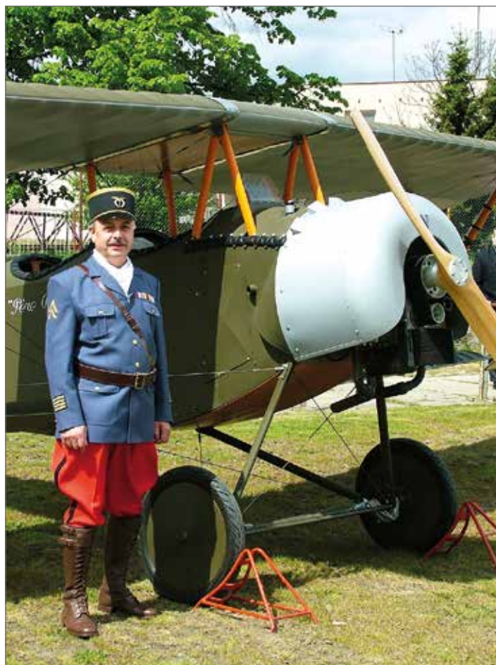
Dobový letecký den, Mladá Boleslav

16. 6. od 13 h OSLAVA 700 LET OBCE VYSKEŘ Vyskeř www.vysker.cz 16. 6. od 16 h KRÁL KAREL (pohádka) K-klub, ul. Smiřických 2, Jičín www.kzmj.cz 16. 6. od 19 h IAN ANDERSON – JETHRO TULL (koncert) Státní zámek Sychrov www.simmiag.cz 16. 6. od 19.30 h KONCERT FOLKOVÉ SKUPINY TROJBOY Hrad Vranov – Pantheon www.vranov-pantheon.cz 16.–17. 6. TRABANTI NA TROSKY! Státní hrad Trosky www.hrad-trosky.eu 16.–17. 6. MUZEJNÍ VÍKEND V TURNOVSKÉM DEPU Železniční depo Turnov www.kolejklub.cz 16.–17. 6. CESTOU ZA DINOSAURY (akce pro děti) Přírodní areál Šťastná země, Radvánovice www.stastnazeme.cz 17. 6. ARCHEOLOGICKÁ PROCHÁZKA MĚSTEM ŽELEZNICE Vlastivědné muzeum Železnice www.muzeumzeleznice.webk.cz 17. 6. od 9 h ZÁMECKÉ SLAVNOSTI Zámek Svijany www.zameksvijany.cz 17. 6. od 19.30 h FESTIVAL NA JIZEŘE – FILUMENA MARTURANO (představení) Letní kino Turnov www.festivalnajizere.cz 19. 6. od 9 h DEN IZS (ukázky záchranného systému) Železný Brod www.zeleznybrod.cz 21. 6. SVÁTEK HUDBY (slavnost) Jičín, na různých místech města www.svatekhubdy.cz 21. 6. Nažďár (slavnost) Valdštejnská lodžie, Jičín valdstejnskalodzie.cz 22. 6. od 19.30 h FESTIVAL NA JIZEŘE – ČECHOMOR (koncert) Letní kino Turnov www.festivalnajizere.cz 22. 6. od 19.30 h SEDMIHORSKÉ LÉTO – UCPANEJ SYSTÉM (divadlo) Areál motelu Even, Sedmihorsky www.sedmihorskeleto.cz