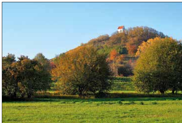
Vrch Zebín (399 m n. m.)

Jako skalní sruby označujeme skalní stěny, které byly modelovány říčním tokem. Proudící voda vytvořila v méně odolných vrstvách stovky metrů dlouhé výklenky, tzv. převisy. Ty nejhezčí