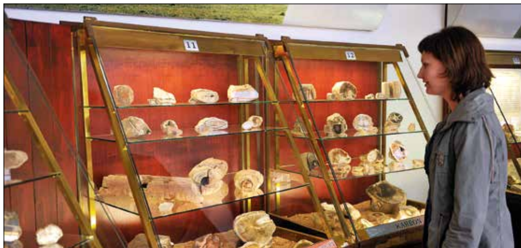
Klenotnice drahých kamenů, Nová Paka

Do Hruboskalského skalního města doporučujeme vyrazit z Turnova. Od vlakové zastávky Turnov-město dojdeme po červené značce na Hlavatice – skálu, která slouží jako rozhledna a je již více než 100 let přístupná po železném schodišti. Odtud pokračujeme směrem na Valdštejn . Cestou budeme