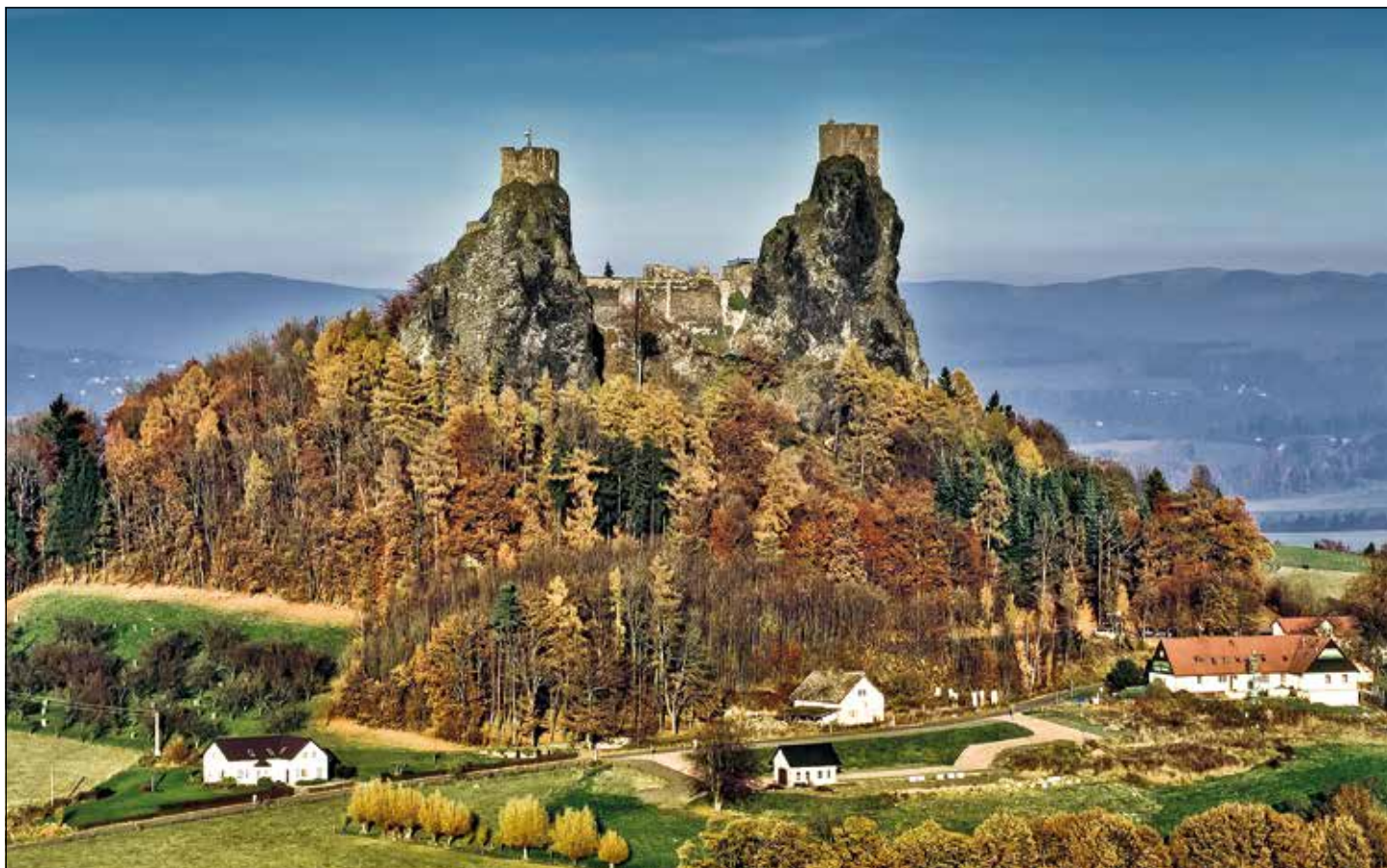
Zřícenina hradu Trosky (488 m n. m.)

Skalní město Příhrazské skály zahrnuje na 178 věží, které stojí převážně v okrajích kaňonovitých údolí.