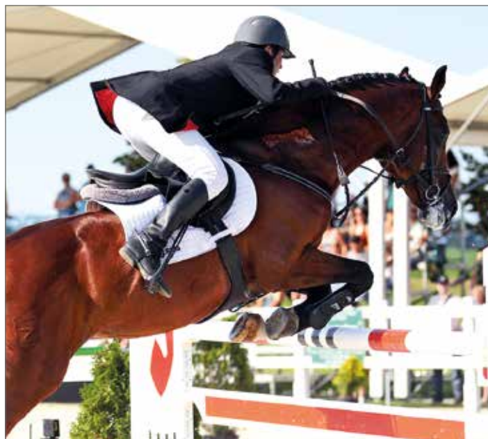
Skokové závody, Ptýrov u Mnichova Hradiště

4.–5. 8. ČERTI NA TROSKÁCH Státní hrad Trosky www.hrad-trosky.eu