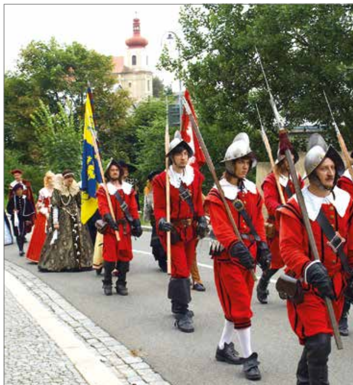
Anenská pouť, Mnichovo Hradiště

24. 7. od 12.30 ODPOLEDNE S VÉVODOU ALBRECHTEM Z VALDŠTEJNA Hrad Valdštejn www.hrad-valdstejn.cz 24. 7. od 18 h KING EDWARD VI. Kostel sv. Ignáce z Loyoly, Jičín www.jicin.org 25. 7. od 19.30 h SKLADATELÉ ČASU PRVNÍ REPUBLIKY (koncert) Kostel sv. Mikuláše z Bari, Lomnice n. Pop. http://dstlomnice.wz.cz/ 25. 7. od 20 h MAGICKÝ TURNOV (večerní prohlídka) Sraz u RTIC v Turnově www.infocentrum-turnov.cz 26. 7. od 19.30 h SEDMIHORSKÉ LÉTO – JIŘÍ PAVLICA A HRADIŠŤAN & VLASTA REDL S KAPELOU Areál motelu Even, Sedmihorky www.sedmihorskeleto.cz 26. 7. od 19.30 h LOUTNA ČESKÁ (koncert) Kostel sv. Mikuláše z Bari, Lomnice n. Pop. http://dstlomnice.wz.cz 27. 7. od 18 h POSEZENÍ S DECHOVKOU POD LIPAMI Padařovice, náves www.sobeslavice.cz 27. 7. od 20 h BEATA BOCEK Valdštejnská lodžie, Jičín valdstejnskalodzie.cz 27.–29. 7. ANENSKÁ POUŤ Mnichovo Hradiště, ulice V Lipách www.mnhradiste.cz 28. 7. ROZMARNÉ LÉTO (oslava léta) Malá Skála, areál Žluté plovárny www.sundisk.cz 28. 7. DEN HER Krásná Louka, Mladá Boleslav www.kulturamb.cz 28. 7. od 10 h VRANOVSKÝ JARMARK Hrad Vranov – Pantheon www.vranov-pantheon.cz 28. 7. od 16 h KOUZLA SKŘÍTKŮ (pohádka) K-klub, ul. Smiřických, Jičín www.kzmj.cz 28. 7. od 16 h LOUTKOVÁ POHÁDKA ANEB PIMPRLENÍ NA ZÁMKU Zámek Lomnice nad Popelkou www.kislomnice.cz 28. 7. od 18 h KONCERT SKUPINY COUNTRY STOCK Padařovice, náves www.sobeslavice.cz