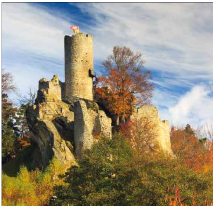
Zřícenina hradu Frýdštejn

Kromě zmíněných sedmihorských pramenů v Hruboskalsku si můžeme udělat výlet i za těmi v Podtrosec-