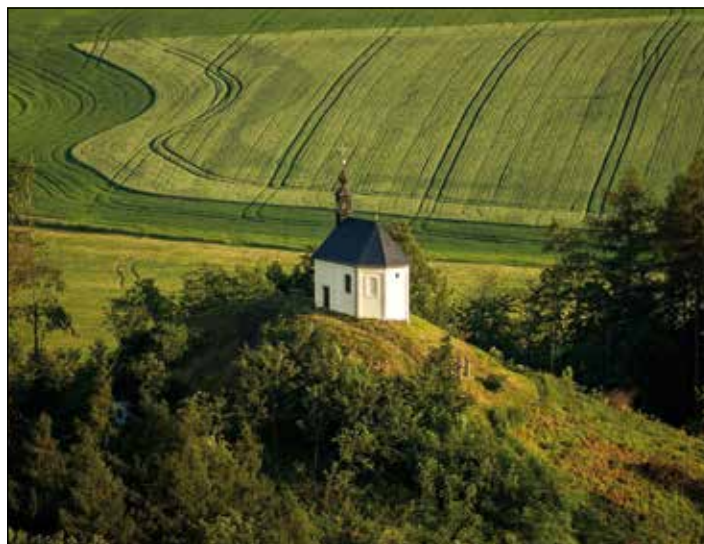
Kaple sv. Anny na sopečném vrchu Vyskeř (466 m n. m.)

Tento významný vrch na Mladoboleslavsku je tvořen zbytky dvou sopek, dnes vrcholy zvanými Baba a Dědek. Při erupci se vytvořily sopečné kužely s puklinami a komíny, které následně vyplnilo čedičové magma. V minulosti zde probíhala těžba, při které byl vybírán pouze kvalitní kámen, a díky tomu vznikly současně bizarní tvary (skalní brány, úzké chodby ad.). Území je zajímavé i rostlinstvem, kterému se na jeho živých půdách daří.