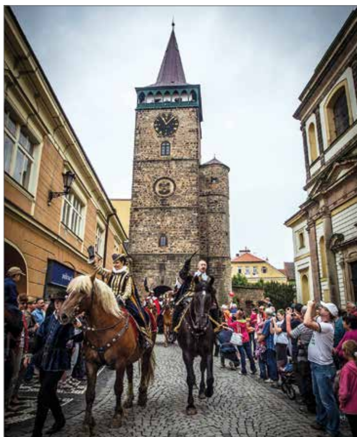
Valdštejnské slavnosti, Jičín

1. 6. NOČNÍ PROHLÍDKA ZÁMKU Zámek Svijany www.zameksvijany.cz 1. 6. SBOR KONZERVATOŘE PARDUBICE Valdštejnská lodžie, Jičín www.valdstejnskalodzie.cz 1.–3. 6. VETERÁNEM ČESKÝM RÁJEM Valdštejnovo náměstí, Jičín www.veteranemceskymrajem.cz 2. 6. MALOSKALSKÁ NOC (festival) Malá Skála u lávky www.maloskalskanoc.cz 2. 6. DĚTSKÝ DEN S IZS A OSLAVA 75. VÝROČÍ ANTIMONY Rovensko pod Troskami, náměstí www.rovensko.cz 2. 6. od 9.30 h JÁ MÁM KONĚ (přehlídka) Lomnice nad Popelkou – Tyršův park www.lomnicenadpopelkou.cz 2. 6. od 11 h STAROMILSKÁ POUŤ DO BZÍ Bzí www.bzos.cz 2. 6. LÍŠENSKÉ POCHODY ČESKÝM RÁJEM TJ Sokol Líšný www.lisenske-pochody.cz 2.–3. 6. DNY STŘEDOVĚKÉ HUDBY Státní hrad Trosky www.hrad-trosky.eu 2.–3. 6. DIVADLO VE ŠTASTNÉ ZEMI Přírodní areál Šťastná země, Radvánovice www.stastnazeme.cz 3. 6. DĚTSKÝ DEN NA PLOVÁRNĚ Malá Skála, areál Žluté plovárny www.sundisk.cz