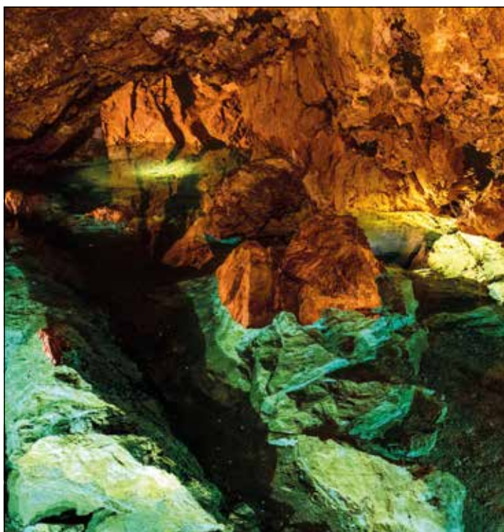
Bozkovské dolomitové jeskyně

Před 5 miliony let se naposledy probudil k sopečné činnosti Kozákov. Lávové proudy přehradily koryto tehdejší řeky. Tok vody usadil šterku na vrstvách čediče. V lomu můžeme pozorovat, jak ještě nedávno holé plochy černošedého kamene zarůstají vegetací.