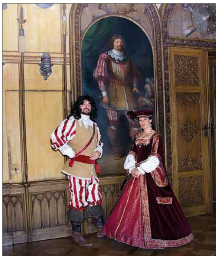
Móda sedmi staletí, zámek Hrubý Rohozec

Nádvoří zámku Lomnice nad Popelkou www.kislomnice.cz