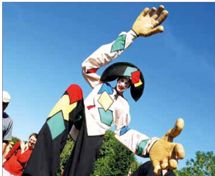
Sobotecký jarmark a festival řemesel

7. 9. IVA BITTOVÁ (koncert) Valdštejská lodžie, Jičín www.valdstejskalodzie.cz 7. 9. NOČNÍ PROHLÍDKA ZÁMKU Zámek Svijany www.zameksvijany.cz 7.–9. 9. PAROHATÁ MĚSTA (přehlídka) Kulturní centrum Golf Semily www.semily.cz 7.–9. 9. LODŽIE WORLD FEST 2018 ANEB SLAVNOSTI IMAGINÁRIA (festival) Valdštejská lodžie, Jičín www.valdstejskalodzie.cz 8. 9. KUMBURSKÉ SVÍTÁNÍ Zřícenina hradu Kumburk www.kumburk.cz 8. 9. 3x KOLEM KALICHA (cyklozávod) Sokol Malá Skála www.xc-malaskala.cz 8. 9. PEGEN (slavnost) Park Ostrov, Semily www.semily.cz 8. 9. MALÝ SEMILSKÝ MONTMARTRE Muzeum a Pojizerská galerie Semily www.semily.cz 8. 9. VIII. POHÁDKOVÁ NOC NA ROTŠTEJNĚ ANEB POJĎTE S NÁMI ZA POHÁDKOU Zřícenina hradu Rotštejn www.hradrotstejn.info 8. 9. od 14 h SEPTEMBERFEST (slavnost) Krásná louka Mladá Boleslav www.kulturamb.eu 9. 9. od 14 h STAROČESKÁ POUŤ U KAPLE PANNY MARIE NA PRACKOVĚ Prackov, prostranství u kaple Panny Marie www.prackov.com 12.–16. 9. JIČÍN – MĚSTO POHÁDKY (festival) Jičín, na různých místech města www.pohadka.cz 15. 9. TAJEMSTVÍ LESA ZVÍŘETICKÉHO (hry) Zřícenina hradu a zámku Zvířetice www.zviretice.cz 15. 9. od 10 h ZAŽÍT HRADIŠTĚ JINAK – SOUSEDSKÁ SLAVNOST Masarykovo náměstí, Mnichovo Hradiště www.mhradiste.cz 15. 9. od 13 h HRUBOSKALSKÉ SLAVNOSTI Doubravice, louka u Libuňky www.obechrubaskala.cz 15. 9. od 19 h MICHAL DAVID – OPEN AIR TOUR Zámek Svijany www.zameksvijany.cz