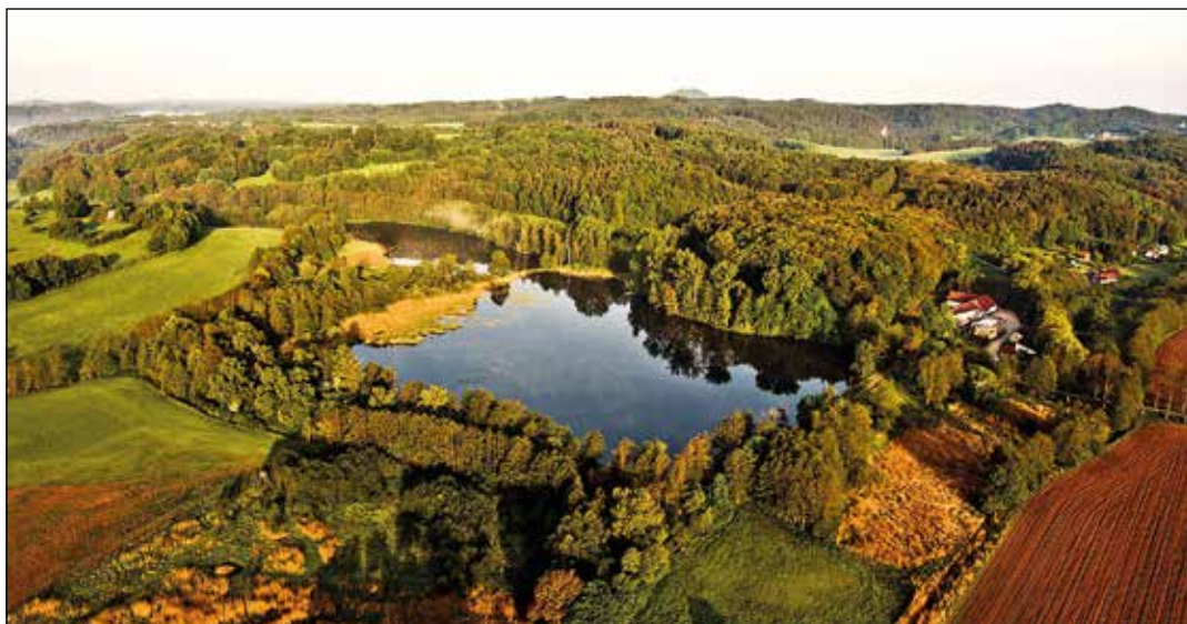
Rokytnický rybník a rybník Hrudka

Zleva pak přitéká potok od nejvýdatnějšího pramene v tomto údolí. Z rozcestí kousek za mlýnem dojdeme po modré do Kacanov , kde můžeme nasednout na cyklobus, nebo se vydat po silnici do Turnova.