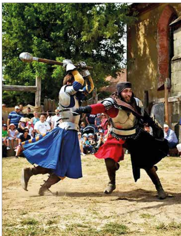
Hrad a zámek Staré Hradky

Každou neděli pohádky pro děti Dlaskův statek, Dolánky u Turnova www.muzeum-turnov.cz