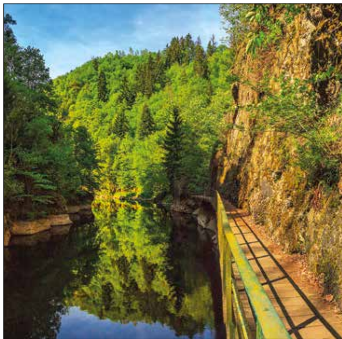
Riegrova stezka, Semily

Jedno z nejznámějších českých pískovcových skalních měst. Jeho věže, až 40 metrů vysoké, přecházejí do skalních stěn a jsou rozčleněny úzkými spárami, komíny a rozsedlinami do několika částí. Skály jsou místy rozděleny suchými skalnatými údolními – tzv. soutěskami (chodbami). Nejzná-